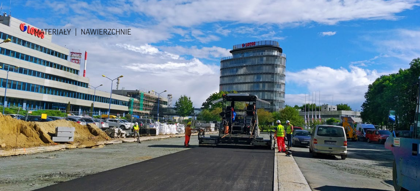
Remont nawierzchni parkingu LOTOS-u z wykorzystaniem granulatu asfaltowego z recyklingu nawierzchni