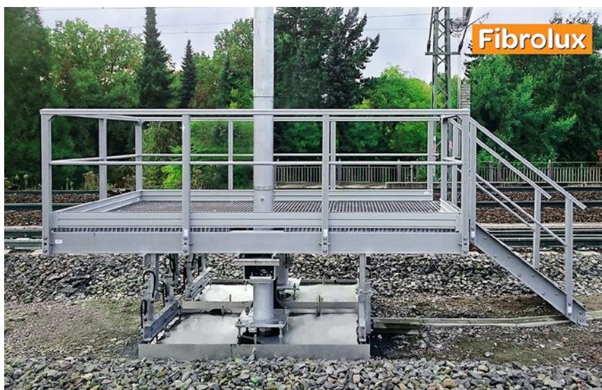
Podest obsługowy dla kolei