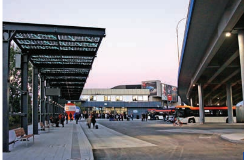
Dworzec Lokalny w Rzeszowie

Od 2006 r. Rzeszów powiększał się co roku o przyległe sołectwa: Słocinę (2006 r. – 9,16 km 2 ) i Załęże (2006 r. – 5,20 km 2 ), Przybyszówkę (2007 i 2008 r. – 16,26 km 2 ), Zwiężycę (2008 r. – 7,23 km 2 ), Białą (2009 r. – 6,06 km 2 ), Budziwój (2010 r. – 17,50 km 2 ), Miłocin (2010 i 2019 r. – 2,36 km 2 ), Bziankę (2017 r. – 4 km 2 ) i Matysówkę (2019 r. – 5,3 km 2 ). Łącznie od 2006 r. terytorium Rzeszowa zostało zwiększone o 72,5 km 2 , na których miasto zainwestowało do tej pory w sumie 2 mld zł. Majątek Rzeszowa wynosi ponad 3,7 mld zł. Według raportu Polskiej Akademii Nauk, jest to jedno z niewielu polskich miast, które nadal będą się rozwijać i zwiększać liczbę mieszkańców.