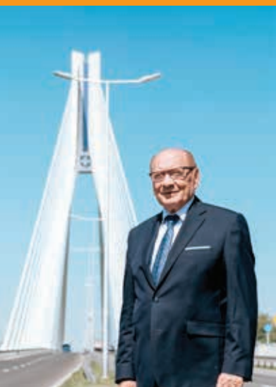
Tadeusz Ferenc, prezydent miasta Rzeszowa

Rzeszów, największe miasto w południowo-wschodniej Polsce i jednocześnie jedno z najstarszych miast w kraju, obchodził na początku 2019 r. 665. rocznicę otrzymania aktu lokacyjnego. Miasto już w XVI w. mogło się pochwalić sprawnie działającą administracją. Obecnie dzięki władzom miasta z prezydentem Tadeuszem Ferencem na czele Rzeszów jest najważniejszym ośrodkiem gospodarczym, kulturalnym i komunikacyjnym Podkarpacia o wciąż rosnącym potencjale.