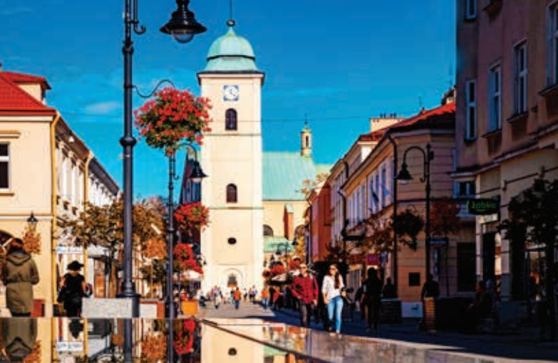
Ulica 3 Maja w Rzeszowie