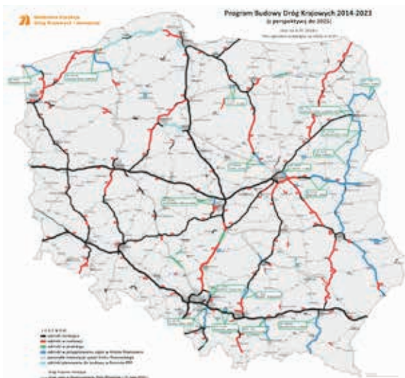
Ryc. 2. Program budowy dróg krajowych 2014–2023 (z perspektywą do 2025 r.), za: https://www.gddkia.gov.pl/userfiles/articles/w/wybudujemy-wiecej-drog-w-ramach_26271/PBDK%202014-2023%20(2025).jpg

pogarszanie się jakości bazy surowcowej złóż. Na wyczerpaniu są złoża typowo żwirowe, maleje również udział zasobów złóż żwirowo-piaskowych, a wzrasta udział zasobów złóż piaskowych, w których udział ziaren drobnych, poniżej 2 mm, wynosi powyżej 75%, podczas gdy budownictwo potrzebuje coraz więcej kruszywy o uziarnieniu grubym. Ta sytuacja powoduje okresowe trudności ze zbytem frakcji drobnych (piaskowych) kruszywy, które w największych ilościach wykorzystuje się w budownictwie drogowym do wykonywania podbudów i innych obiektów ziemnych oraz w rekultywacji terenów pogórnich i przemysłowych. W wielu regionach kraju od ilości wykonywanych inwestycji drogowych w danym okresie zależy ilość zagospodarowywanych trudno zbywalnych drobnych frakcji piaskowych kruszywy. W przypadku braku odbiorców na te kruszywa kopalnie z konieczności traktują je często jako frakcje nieużyteczne (pozaklasowe).