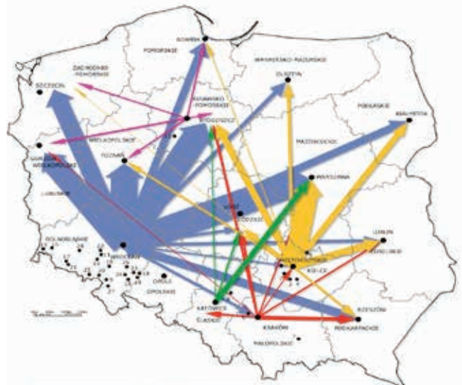
Ryc. 1. Kierunki i struktura przewozu kruszyw łamanych do głównych odbiorców [11]

Większość surowców skalnych, z których produkowane są w Polsce kruszywa mineralne stosowane w budownictwie drogowym, zalega na południu. Dotyczy to szczególnie skał magmowych, z których produkowane są najlepsze jakościowo drogowo kruszywa łamane, oraz skał metamorficznych (amfibolity, migmatyty, gnejsy, serpentynity). W Polsce centralnej i południowej eksploatowane są głównie skały osadowe (wapienie, dolomity, piaskowce, piaskowce kwarcytowe) i kruszywa piaszczysto-żwirowe. Piaski i żwiry w znacznych ilościach wydobywa się na północy kraju. W północnej i środkowej strefie kraju wykorzystywane są też w drogownictwie polodowcowe głązy i otoczaki, z których produkowane są odpowiedniej jakości kruszywa łamane. Zapotrzebowanie na naturalne kruszywa łamane w dużym stopniu zależy od wielkości realizacji budownictwa drogowego i kolejowego, a w mniejszym stopniu od stanu budownictwa kubaturowego (kruszywa łamane ze skał magmowych stosowane są m.in. do produkcji betonów wysokich klas). Szybki wzrost zapotrzebowania na kruszywa łamane na początku XXI w. był głównie spowodowany realizacją dużych inwestycji drogowych, kolejowych, a także niektórych innych przedsięwzięć infrastrukturalnych.