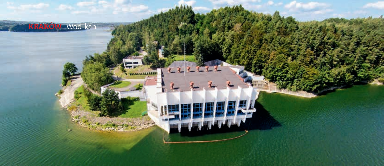
Ujęcie wieżowe nad Jeziorem Dobczyckim, zbiornikiem retencyjnym na Rabie

oprogramowania dla systemu AMR umożliwia odczyt liczników znajdujących się w zasięgu punktu dostępowego. Oprócz bieżącego stanu wodomierza dostępne są również informacje o adresie umiejscowienia wodomierza, sile sygnału, stanie baterii oraz dacie i czasie odczytu. W programie przewidziano możliwość odczytania wybranych z listy liczników oraz zapis odczytanych wyników do pliku wraz z aktualną datą i czasem pomiaru. W przypadku posiadania przez zarządcę oprogramowania do rozliczeń zużycia wody może on zintegrować system AMR z posiadanym oprogramowaniem.