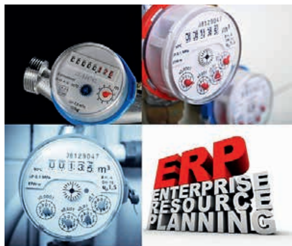
Różne typy wodomierzy

Wersja inkasencka została opracowana z myślą o domach jednorodzinnych. Stanowi połączenie klasycznego manualnego odczytu liczników z najnowocześniejszymi osiągnięciami techniki. Inkasent dokonujący odczytu licznika wyposażony jest w komputer przenośny, połączony z modułem nadawczo-odbiorczym (tzw. kolektor danych) odczytujący dane z modułów radiowych zainstalowanych przy wodomierzach. Następnie dane te są gromadzone w bazie danych w przenośnym komputerze, skąd mogą zostać eksportowane do programu rozliczeniowego zarządcy. Osoba odczytująca nie musi wchodzić na teren posesji, wystarczy, że się do niej zbliży. W takim zestawie niezbędne jest oprogramowanie umożliwiające przesył zapisanych w komputerze inkasenckim danych do komputera zarządcy bądź centrum rozrachunkowego. Podstawowa wersja