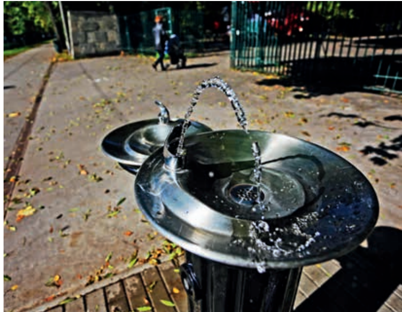
Poidelko uliczne z wodą do picia

„Wodociągi Miasta Krakowa wdrażają system zdalnych odczytów wodomierzy. Obecnie większość eksploatowanych wodomierzy jest wyposażona w nakładki do zdalnych odczytów,