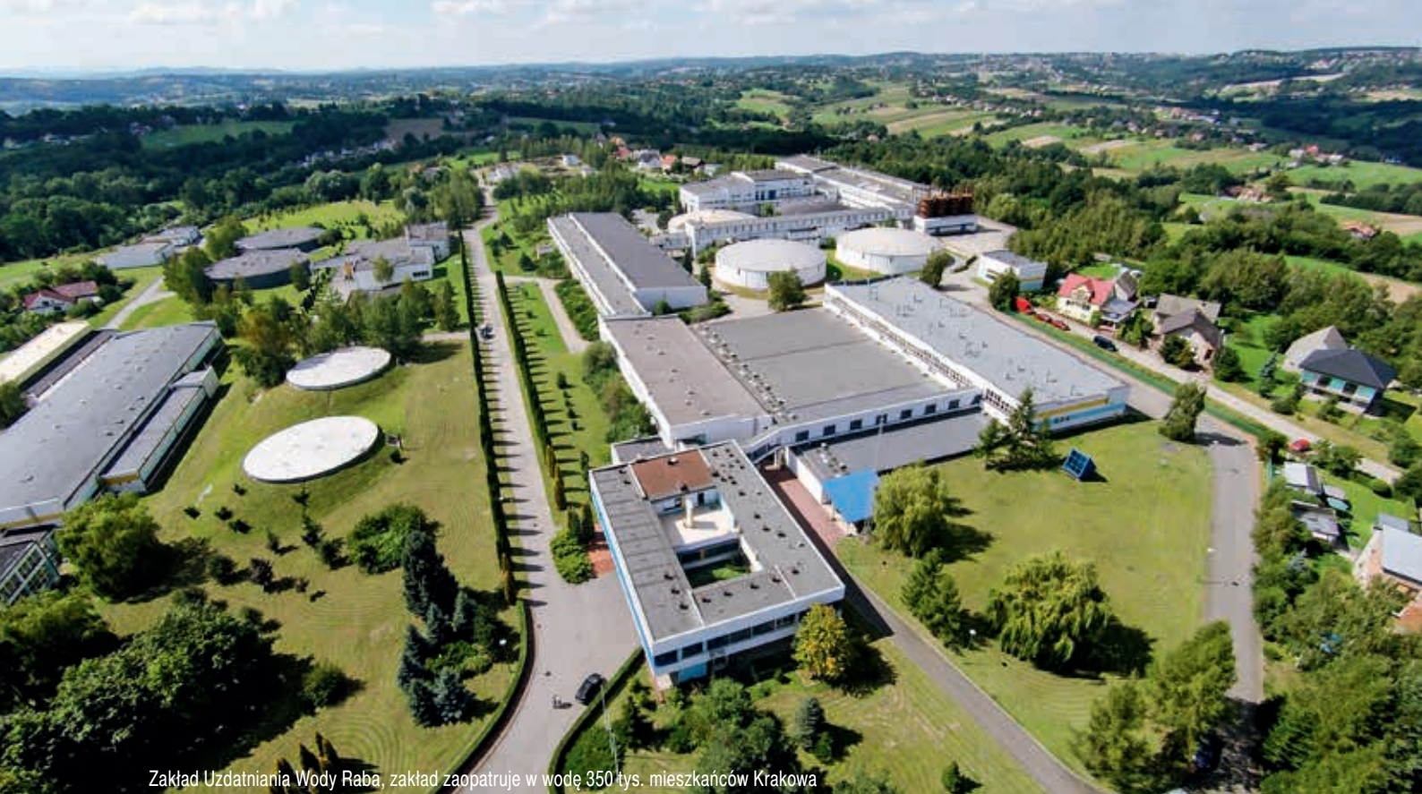
Zakład Uzdatniania Wody Raba, zakład zaopatruje w wodę 350 tys. mieszkańców Krakowa