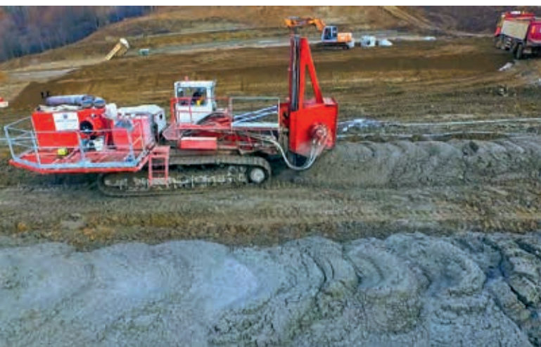
Fot. 3. Wzmocnienie podłoża gruntowego w technologii TRMX

Doświadczona kadra projektowa i nadzór techniczny z ramienia konsorcjum geotechnicznego oraz bogate zaplecze naukowo-techniczne pozwoliły na wypracowanie optymalnej koncepcji i zrealizowanie trudnego zagadnienia geotechnicznego.