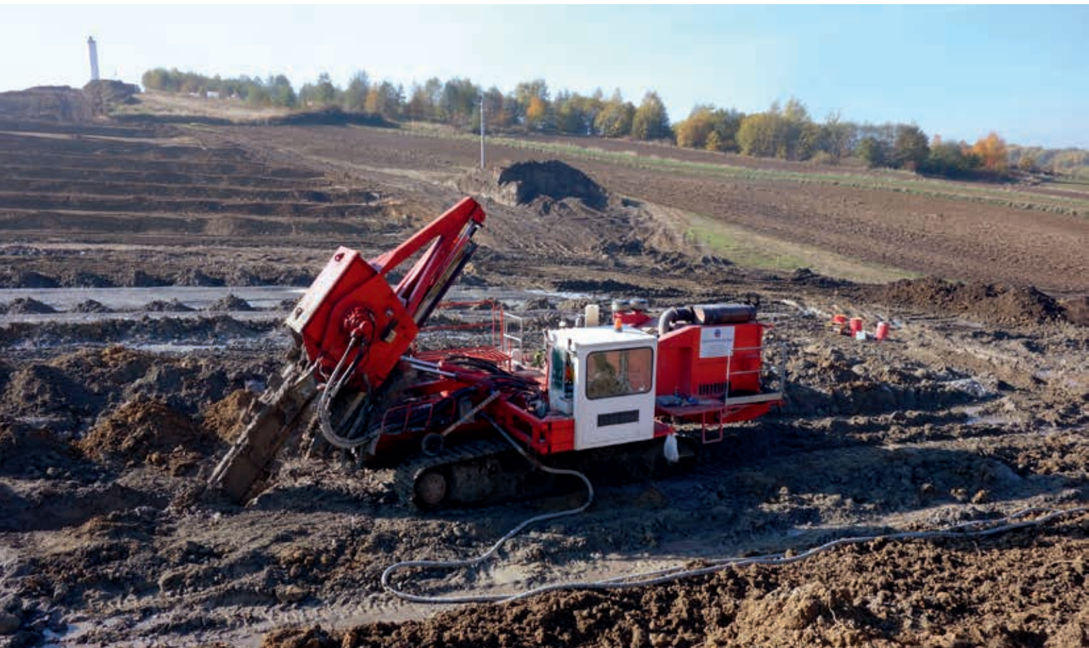
Fot. 2. Ukształtowanie terenu oraz schodkowanie platformy