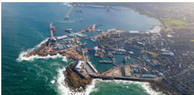
Port rybacki Peterhead w Szkocji

Obecnie SSAB realizuje projekt z zastosowaniem innego rozwiązania. Jest to konstrukcja palościanki typu RD® w porcie rybackim Peterhead w Szkocji. Ten typ konstrukcji oporowej, opartej na wykorzystaniu wwiercanych pali stalowych, rekomendowany jest do zastosowania w trudnych warunkach gruntowych. Zamki przyspawane do pali w warunkach warsztatowych gwarantują utrzymanie kierunku prostego elementów, co ułatwia montaż. W przypadku tego projektu przy wykorzystaniu jednej maszyny wiertniczej firma McLaughlin & Harvey zainstalowała 1062 pale o średnicy 610 mm w wyznaczonym przez inwestora terminie.