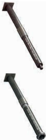
Pale stalowe typu RR (wbijane) oraz RD (wwiercane)

istniejących już obiektów. W szczególnie niekorzystnych warunkach gruntowych rekomendowane jest wzmocnienie stopy pala przez zastosowanie ostrzy skalnych. Ostrza zabezpieczają dolną część pali przed możliwym poprzecznym przesuwaniem się podstawy pala oraz na wypadek pojawienia się szczytowego naprężenia w momencie montażu. Umożliwiają przejście pali przez warstwy gruzu i innych zalegających w gruncie przeszkód bezpośrednio do warstwy nośnej. Firma SSAB jest producentem ostrzy do rur stalowych o dużych średnicach. Produkcja odbywa się w warunkach warsztatowych, gdzie po precyzyjnym wstępnym nagraniu elementów ostrza zostają przyspawane do pali. Techniczne warunki dostawy są zgodne z normą SFS-EN 10219-1. Ostrza posiadają atesty 3.1.