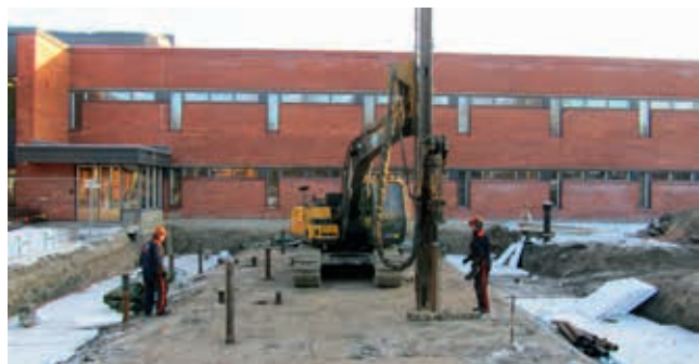
Rozbudowa kompleksu szkolnego Moisiso w Salo w Finlandii

Z kolei przy rozbudowie kompleksu szkolnego Moisiso w fińskim Salo zdecydowano się na wybór pali o mniejszej wadze, ale w wyższym gatunku stali – S550J2H. W ten sposób można zaoszczędzić ok. 10% masy materiału bez utraty skutecznej nośności pala. Mniejszy tonaż oznacza mniej zużytej energii w procesie produkcji, transporcie i montażu, co przekłada się na mniejszą ingerencję w środowisko naturalne ( green building ).