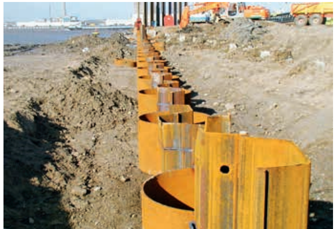
Typowa palościanka z wykorzystaniem pali RR® oraz grodzic typu U