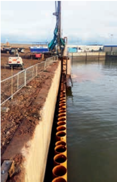
Montaż palościanki RD® w porcie rybackim Peterhead