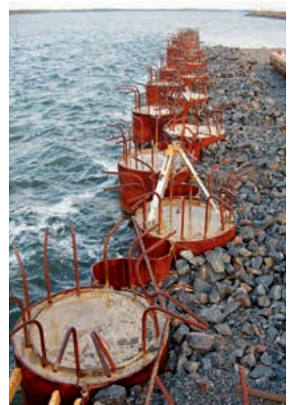
Palościanka typu zig-zag

Pale stalowe dzięki wielu dostępnym średnicom i grubościom ścianek (SSAB może wyprodukować pale na wymiar) oraz możliwościom dopasowania wskaźnika wytrzymałości do wymogów projektu są szeroko stosowane w projektach hydrotechnicznych. Porty w swoich strategiach rozwoju na kolejne lata zakładają pogłębianie, poszerzanie torów wodnych, wydłużanie nabrzeży, zwiększanie wymiarów obrotnic. Wszystko to dla zagwarantowania konkurencyjności portów, zwiększenia bezpieczeństwa i osiągnięcia zakładanych zysków. Biorąc pod uwagę szeroki zakres produkcyjny naszej firmy oraz wieloletnie doświadczenie w tej branży, SSAB czeka na wyzwania związane z realizacją nowych, wymagających inwestycji.