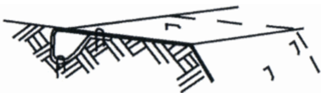
Ryc. 4. Rowek kotwiący

Drugą grupę materiałów stosowanych jako ochrona antyerozyjna skarp stanowią produkty biodegradowalne (ryc. 3). Można tu wyróżnić biowłókniny wykonane z włókien naturalnych z umieszczonymi w runie nasionami traw, geosiatki i geotkaniny wykonane z włókien naturalnych (bądź z domieszką włókien syntetycznych lub biodegradowalnych) oraz maty z włókien naturalnych. Zarówno tkaniny, jak i maty antyerozyjne wykonane są z naturalnych włókien ulegających biodegradacji.