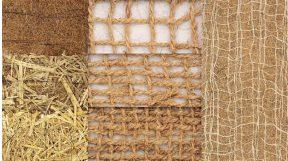
Ryc. 3. Maty biodegradowalne IGG

posiadać otwory umożliwiające przepływ wody równoległe do płaszczyzny skarpy.