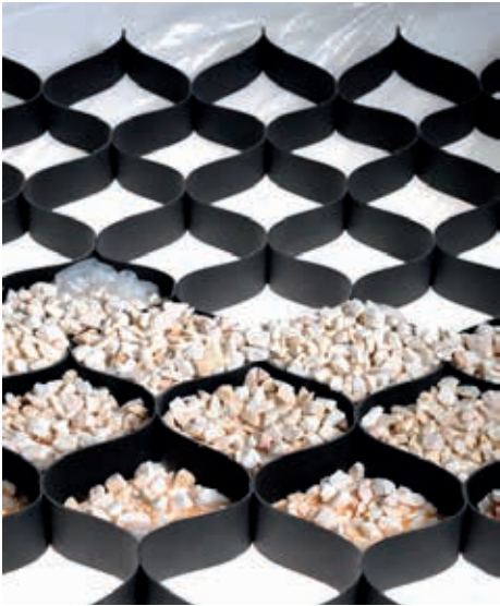
Ryc. 2. Geokrata Taboss