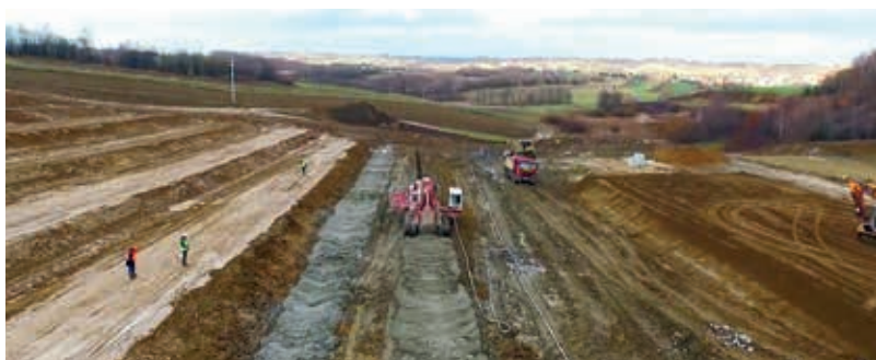
Droga ekspresowa S19 – realizacja wzmocnienia gruntu w technologii Trenchmix

Budowa drogi ekspresowej S19 jest realizowana w systemie zaprojektuj i zbuduj, a firmy Soletanche Polska Sp. z o.o., Menard Polska Sp. z o.o. i Eurovia Polska SA (generalny wykonawca inwestycji) tworzą konsorcjum geotechniczne.