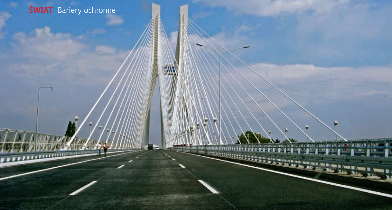
Bariery Stalprodukt SA – A8 Autostradowa Obwodnica Wrocławia, fot. Stalprodukt SA

barier. Problem dotyczył barier, które nie spełniały wymogów normy EN1317 (powstały przed jej wprowadzeniem lub zostały niewłaściwie wykonane). Z badań przeprowadzonych w ramach programu wynika, że uderzenia w bariery stanowią poniżej 15% wszystkich kolizji, a negatywne skutki uderzenia w barierę są ok. dwukrotnie mniejsze od skutków wjechania do rowu oraz niemal trzykrotnie mniejsze niż w przypadku uderzenia w drzewo.