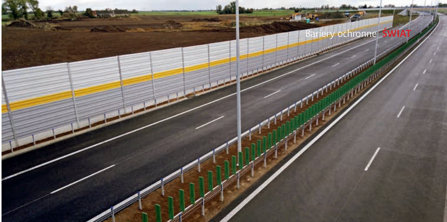
Bariery ochronne – autostrada A1, Toruń – Nowe Marzy

największe szanse przeżycia. Projekt został poddany konsultacjom środowiskowym, w które włączyło się szerokie grono przedstawicieli branży – reprezentantów firm oraz instytucji związanych z infrastrukturą drogową. Wśród ostatecznych rekomendacji zgłoszonych po przeanalizowaniu głosów w dyskusji środowiskowej podczas konferencji, która odbyła się 28 listopada 2014 r., znalazł się m.in. postulat prowadzenia prac nad Wytycznymi dwutorowo. Funkcjonujące opracowanie z 2010 r. powinno być dostosowane do nowej sytuacji, związanej z obowiązującą normą PN-EN 1317, oraz skorygowane w miejscach zdezaktualizowanych bądź zawierających błędne zapisy. Ponadto powinny odzwierciedlać najnowszy stan wiedzy technicznej, czerpanej z różnych źródeł, w tym z wielu szczegółowych uwag zgłaszanych podczas konsultacji. Tymczasem nadal obowiązującym dokumentem są Wytyczne z 2010 r. [2].