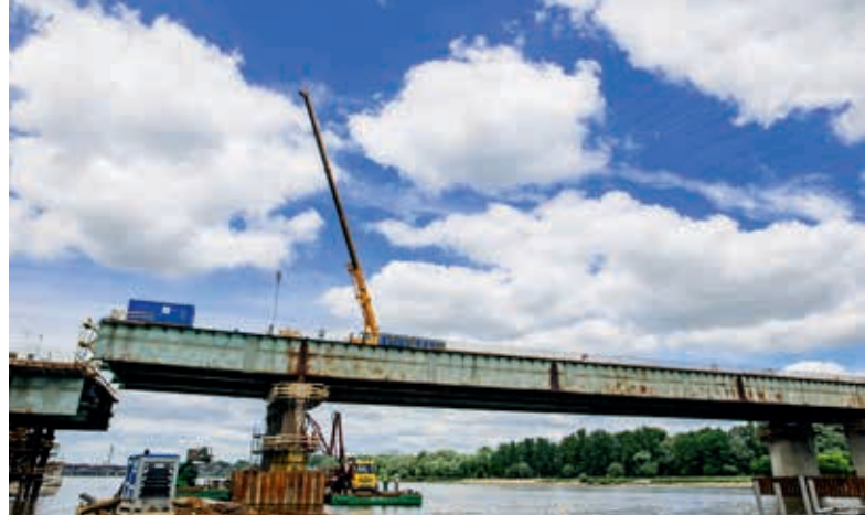
Odbudowa mostu Łazienkowskiego w Warszawie