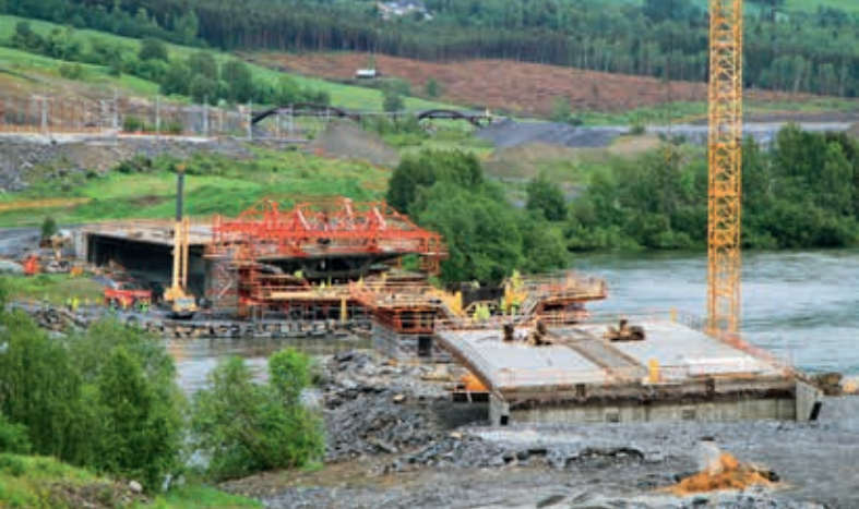
Budowa most Harpe w Norwegii