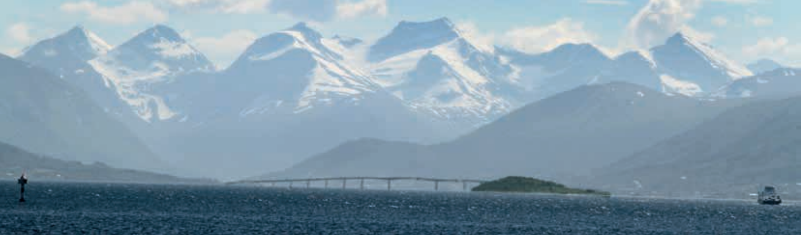
Most Tresfjord na tle fiordu i gór, miejscowość Molde, Norwegia