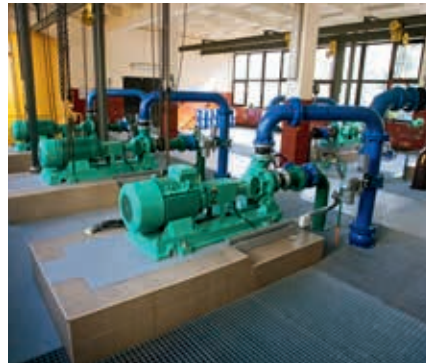
Hala pomp pompowni Mistrzejowice