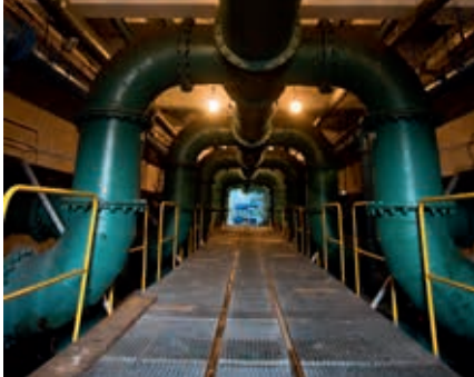
Galeria pod filtrami pospieszonymi w ZUW Rudawa