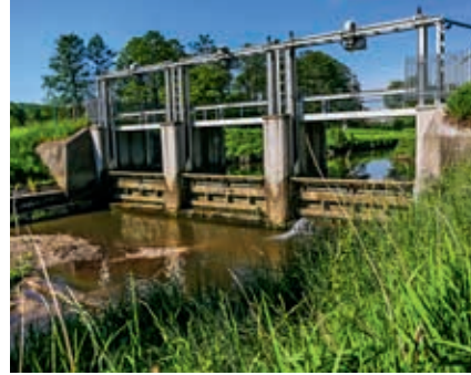
Ujęcie wody na jazie w Szczyglicach

czepną dla pompowni wody czystej, wyposażonej w cztery agregaty pompowe typu PŁK 350 o wydajności 166,7 dm 3 /s przy wysokości wznoszenia 66 m sł. w. Pompownia tłoczyła wodę rurociągami do magistrali miejskiej w ul. Piastowskiej.