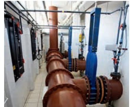
Rurociąg wody surowej z Zestawic

dzono samoczynną regulację prędkości filtracji za pomocą regulatorów hydraulicznych sterowanych olejem pod ciśnieniem.