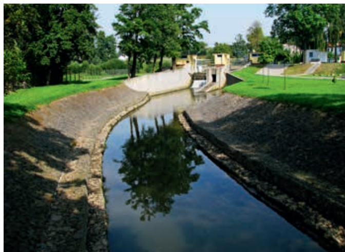
Ujęcie wody na jazie w Raciborowicach

Nie od początku zakładano, że rzeka Dłubnia będzie zaopatrywać Nową Hutę. Koncepcja przyjęta jeszcze w kwietniu 1949 r. w Ministerstwie Przemysłu przewidywała, że nowe miasto będzie posiadać dwa niezależne źródła wody pitnej: ujęcie własne oraz w przypadku przerwy w jego działaniu – transfer z wodociągu krakowskiego. Zapotrzebowanie na wodę oceniano na ok. 8,2 tys. m 3 /d dla osiedla mieszkaniowego oraz 740 m 3 /d dla kombinatu. Ujęciem własnym miały być wody podziemne ujmowane w studniach głębinowych. W latach 1951–1953 rozpoczęto budowę takiego ujęcia w okolicach Mistrzejowic oraz układanie sieci wodociągowej i kanalizacyjnej na terenie Nowej Huty. Zaplanowano wybudowanie siedmiu