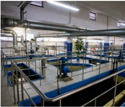
Hala mieszaczy powolnych ZUW Dłubnia