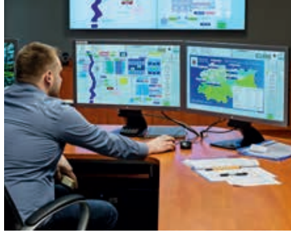
Dyspozytornia ZUW Rudawa