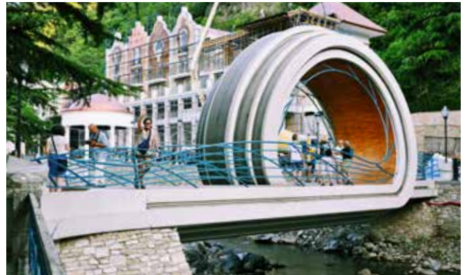
Ryc. 26. Betonowa kładka dla pieszych w kształcie spinacza w Borżomi