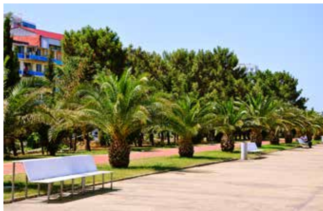
Ryc. 10. Nadmorska promenada w Batumi