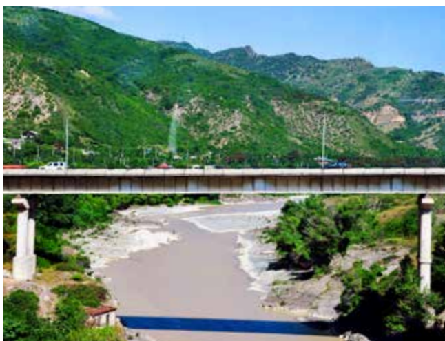
Ryc. 3. Drogowy most belkowy na wyjeździe z Tbilisi w kierunku Mcchety

Po smacznym lunchu w Gori udaliśmy się w dalszą podróż – przez region Imeretii – do Batumi, stolicy regionu