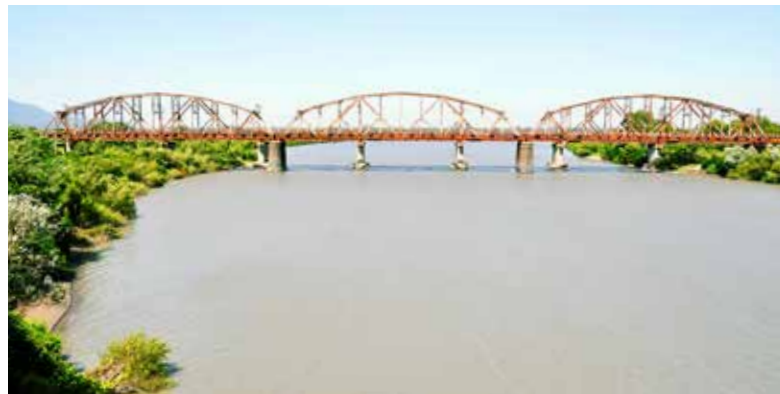
Ryc. 17. Kolejowy most kratownicowy przez Rioni (w tle stalowy most belkowy)