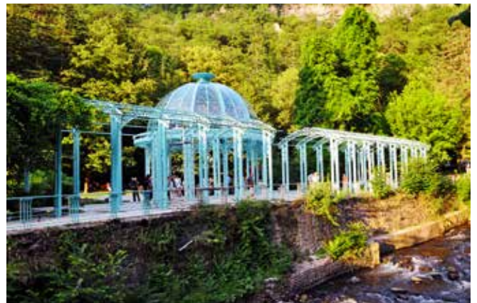
Ryc. 27. Park Zdrojowy w Borżomi