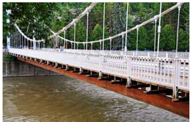
Ryc. 28. Stalowy wiszący most drogowy przez Mtkvari w Borżomi