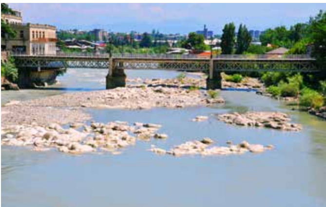
Ryc. 23. Trójprzęsłowy, stalowy most kratownicowy przez Rioni w Kutaisi