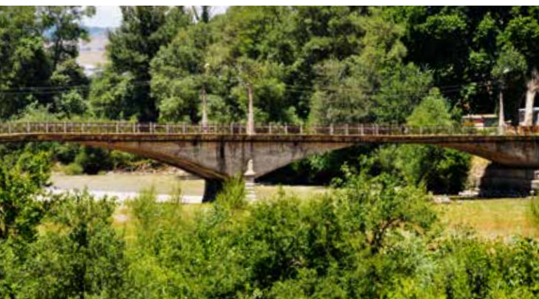
Ryc. 7. Żelbetowy most łukowy (łuki tarczowe) przez Mtkvari w Gori