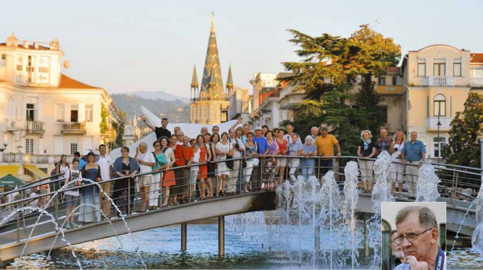
Ryc. 1. Uczestnicy Wyprawy Mostowej w Batumi