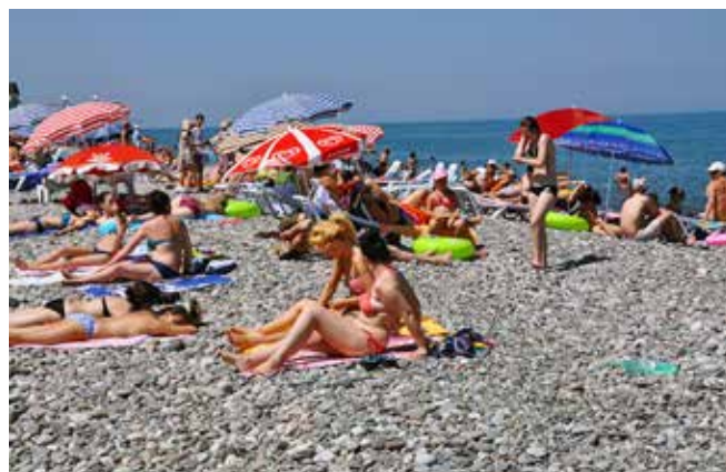
Ryc. 13. Kamienista plaża w Batumi