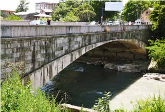
Ryc. 21. Żelbetowy most łukowy przez rzekę Rioni w Kutaisi