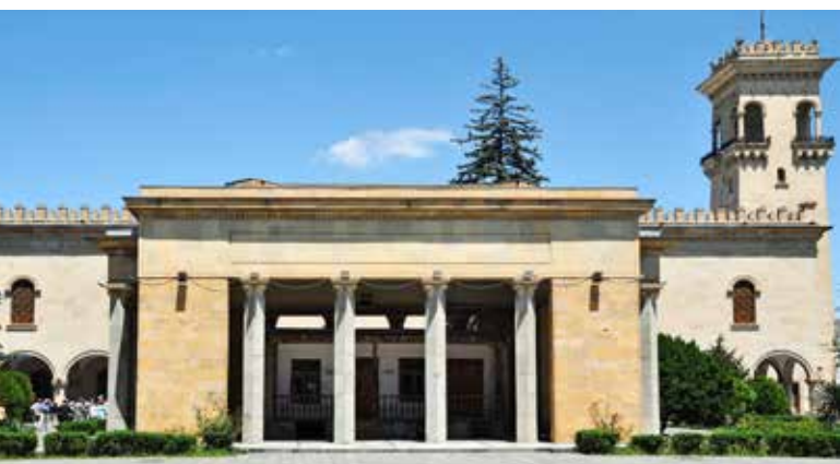
Ryc. 9. Dom-muzeum Józefa Stalina w Gori