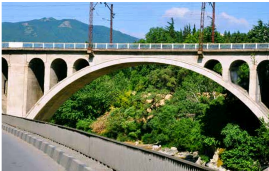
Ryc. 2. Łukowy, betonowy most kolejowy na wyjeździe z Tbilisi w kierunku Mcchety

muzeum jest niczym skansen, w którym czas zatrzymał się w 1953 r., roku śmierci Stalina. Obok muzeum znajduje się – pod monumentalnym zadaszeniem – mały domek szewca Wissarionowicza Dżugaszwilego, ojca Stalina. Tu przyszły dyktator ZSRR (urodzony w 1879 r.) wraz z rodzicami wynajmował jeden pokój. W piwnicy domu ojciec Stalina miał swój warsztat szewski. W okolicznym parku stoi jeden z ostatnich na świecie pomników Stalina, a także 84-tonowy wagon pociągu, którym podróżował. W restaurowanym obecnie parku widoczne są dwa ciekawe betonowe mostki łukowe.