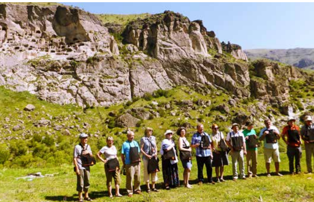
Ryc. 29. Uczestnicy wyprawy na tle jaskiniowego miasta i klasztorów skalnych w Wardzji, fot. J. Kędzińska

czekała nas jeszcze jedna impreza, tradycyjnie obchodzony tzw. półmetek wyprawy. Były przemówienia, toasty, prezentacje, wspólne śpiewanie a także tort z 20 świeczkami, symbolizującymi fakt, że to już XX Europejska Wyprawa Mostowa.