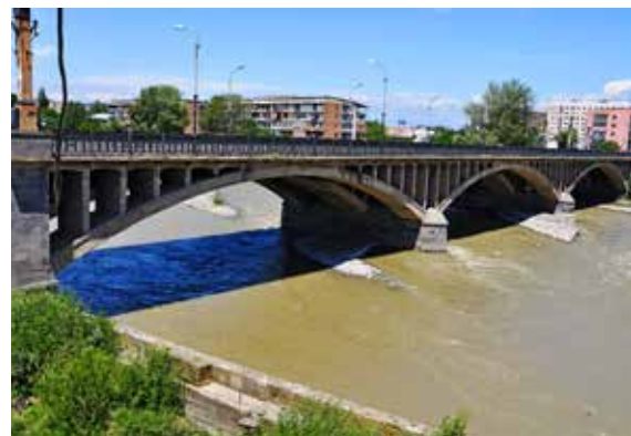
Ryc. 5. Żelbetowy most łukowy przez Mtkvari w Gori

Następnie zwiedziliśmy główną atrakcję Gori – Muzeum Józefa Stalina . Znajdują się tutaj pamiątki po tym wodzu,