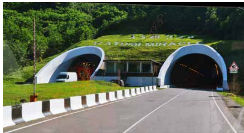
Ryc. 16. Tunel wjazdowy do Batumi