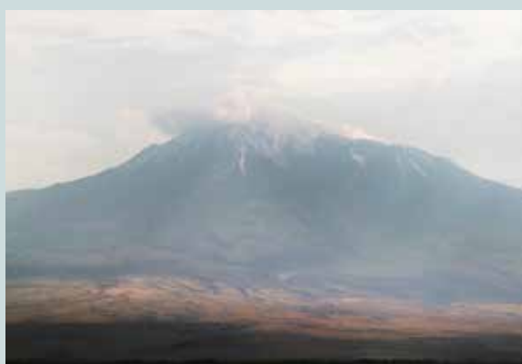
Zamglony szczyt góry Ararat