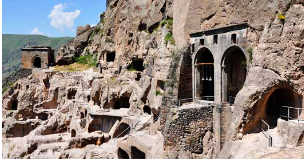
Ryc. 30. Cerkiew Wniebowzięcia NMP w Wardzii

Dalej podążaliśmy zielonym wąwozem rzeki Mtkvari, by zatrzymać się przy twierdzy Chertwisi , wyrastającej malowniczo na skale. Poniżej zbiegają się rzeki Mtkvari i Parawani; przez Parawani przerzucona jest wisząca na linach kładka dla pieszych, z portalowymi pylonami z rur stalowych, drewnianym pomostem i balustradami z siatki ogro-