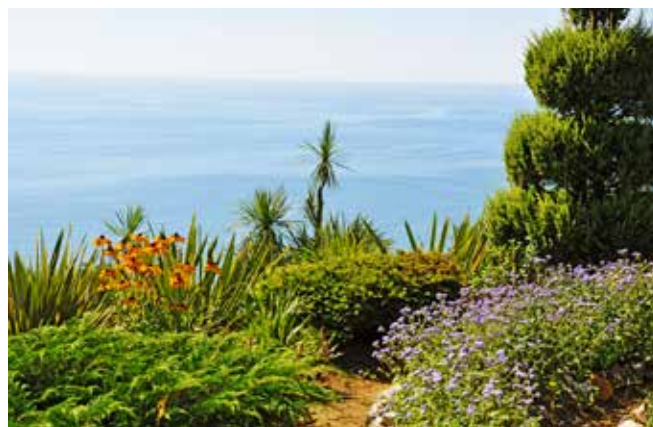
Ryc. 12. Widok z Ogrodu Botanicznego w Batumi na Morze Czarne