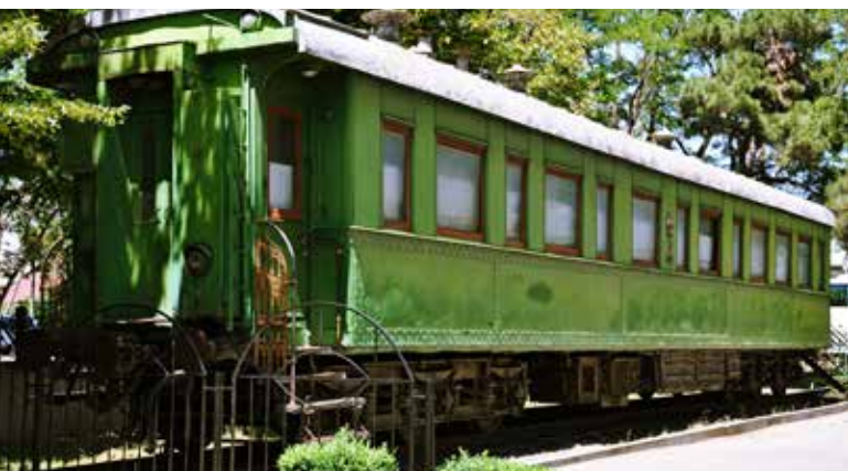
Ryc. 8. 84-tonowy wagon kolejowy, którym podróżował Józef Stalin