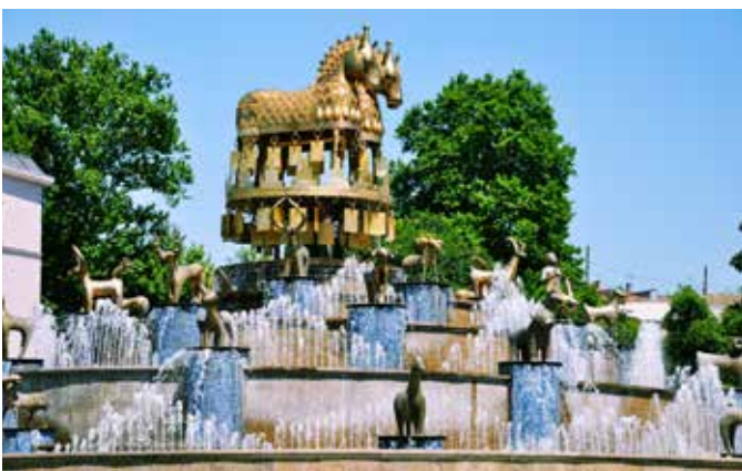
Ryc. 24. Fontanna Kolchidzka w Kutaisi