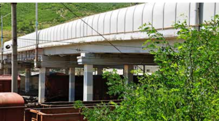
Ryc. 6. Wiadukt drogowy nad torami kolejowymi w Gori