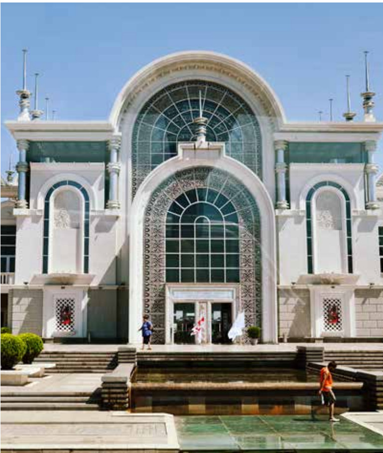
Ryc. 14. Reprezentacyjna zabudowa Batumi