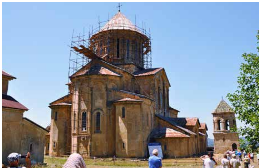
Ryc. 20. Wejście do monasteru Gelati

Późnym wieczorem dotarliśmy do celu piątego dnia naszej podróży – Batumi.