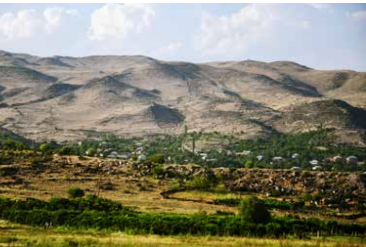
Ryc. 31. Krajobraz Armenii za granicą z Gruzją