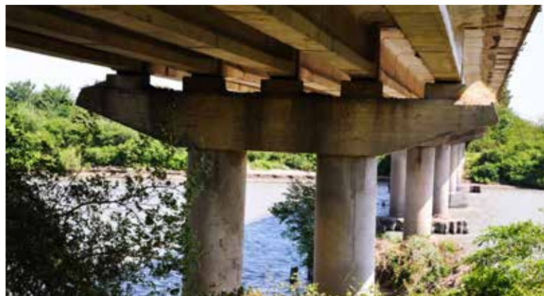
Ryc. 18. Betonowy most drogowy z belek prefabrykowanych przez Rioni