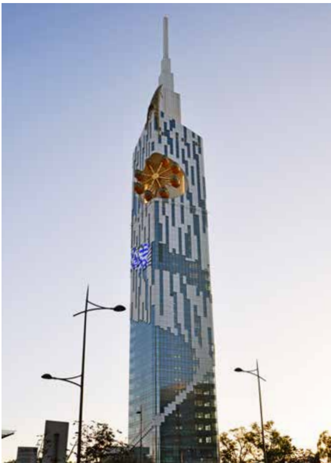
Ryc. 15. Budynek Uniwersytetu Amerykańsko-Gruzińskiego w Batumi