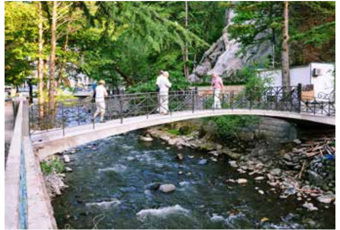
Ryc. 25. Żelbetowa, łukowa kładka dla pieszych w Borżomi