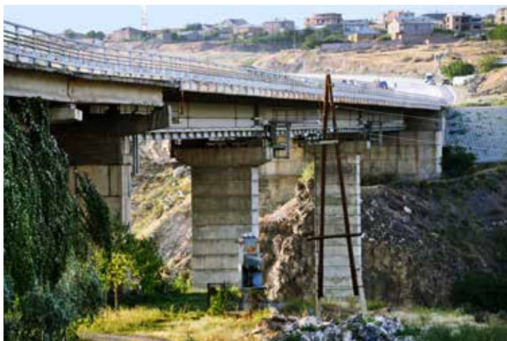
Ryc. 32. Stalowe przęsła mostu na dojeździe do Erywanu