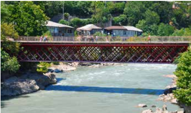
Ryc. 22. Jednoprzęsłowy, stalowy most kratownicowy przez Rioni w Kutaisi