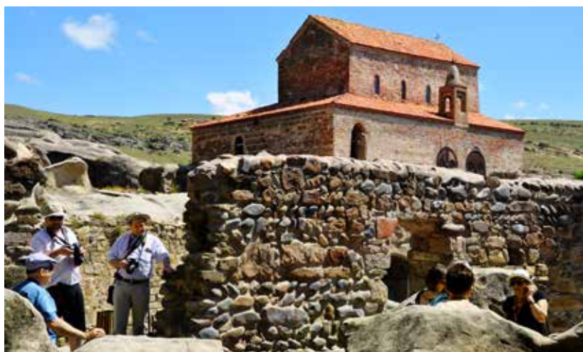
Ryc. 4. Cerkiew z XII w. w Upliscyche

granicy z tą autonomiczną republiką. Szybko dotarliśmy do Upliscyche 1 , w której znajduje się słynne skalne miasto, powstałe z piaskowca. Zamieszkałe było już w czasach prehistorycznych i aż do końca XII w. było ważnym ośrodkiem handlu na Jedwabnym Szlaku . W wiekach X–VI p.n.e. Upliscyche pełniło już funkcję miasta i było twierdzą przywódców plemiennych. Od VI w. p.n.e. do III w. n.e. było jednym z najpotężniejszych centrów politycznych, kulturowych i ekonomicznych, a także siedzibą królewską. Poważnie zniszczone podczas najazdów mongolskich w XIII w., ostatecznie upadło w XIV w. Po restauracji w 1957 r. największe wrażenie robi komnata zwana salą tronową królowej Tamar (1184–1213),