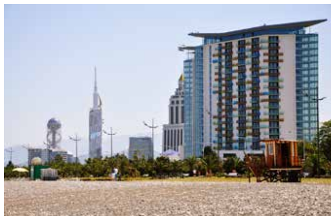
Ryc. 11. Widok zabudowy Batumi z kamienistej plaży