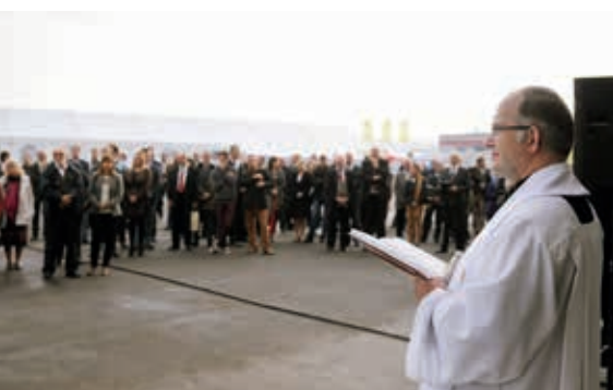
Poświęcenie zakładu produkcyjnego w Olszowej

Firma HABA-Beton istnieje na polskim rynku od 10 lat. Jako pierwsze powstało małe biuro sprzedaży, a prefabrykaty betonowe i żelbetowe były produkowane w Niemczech, skąd dostarczano je do Polski. Czas pokazał, że popyt na prefabrykaty oferowane przez firmę HABA-Beton był tak duży, że doprowadziło to do wybudowania zakładu produkcyjnego.