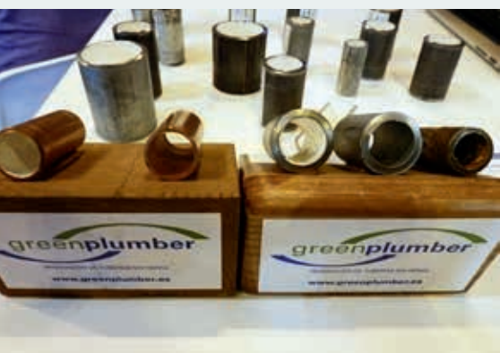
Ryc. 7. Urządzenia firmy hiszpańskiej specjalizującej się w bezinwazyjnej rehabilitacji instalacji wewnętrznych

Jedną z firm hiszpańskich zaproponowała bardzo interesującą metodę czyszczenia, a następnie bezinwazyjnej renowacji (ryc. 7) wewnętrznych instalacji stalowych i żeliwnych o średnicach od 1/2 do 3". Ściany wewnętrzne tych przewodów pokrywane są powłoką epoksydową. Metoda ta znana jest w Polsce, ale wyłącznie w odniesieniu do zewnętrznych przewodów wodociągowych.