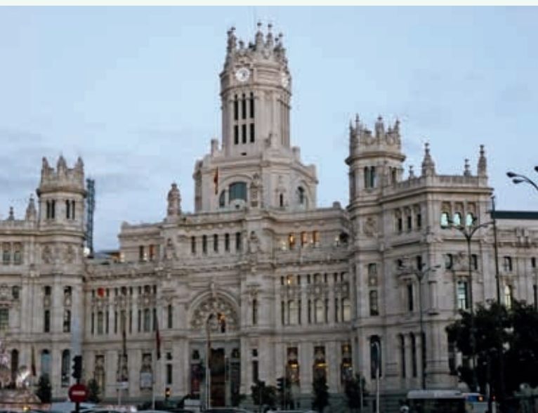
Ryc. 1. Pałac Cibeles w pobliżu Museo Prado

Tegoroczny międzynarodowy No-Dig odbył się 13–15 października 2014 r. w Madrycie. Tradycyjnie konferencji towarzyszyła wystawa.