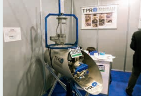
Ryc. 8. Urządzenie stosowane w technologii TPR