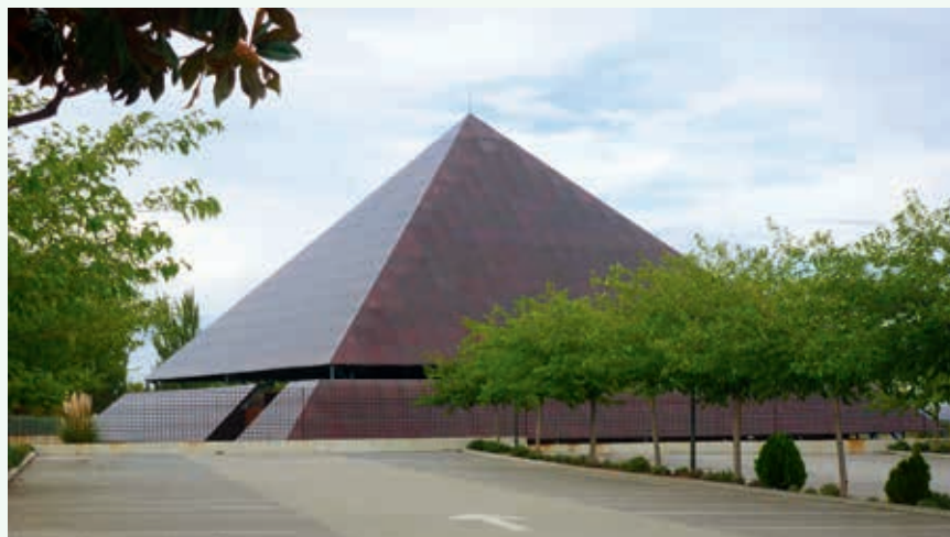
Ryc. 2. Piramida solarna zasilająca w energię elektryczną pojazdy transportujące ludzi w nowo wybudowanym parku przy centrum kongresowo-wystawienniczym Feria de Madrid

Jednocześnie z sesjami poświęconymi bezwykopowej budowie odbywały się