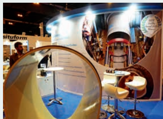
Ryc. 10. Stanowisko firmy Hobas