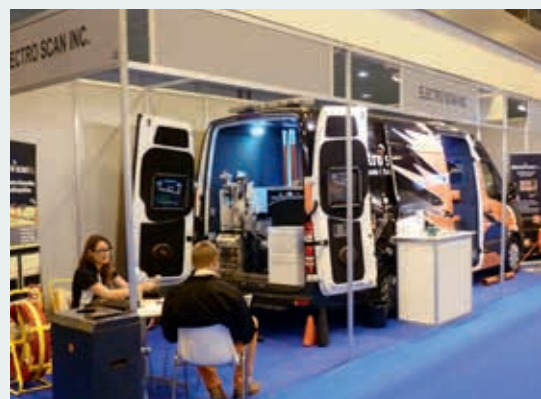
Ryc. 9. Stanowisko amerykańskiej firmy z wyposażeniem do elektroskanywania przewodów kanalizacyjnych