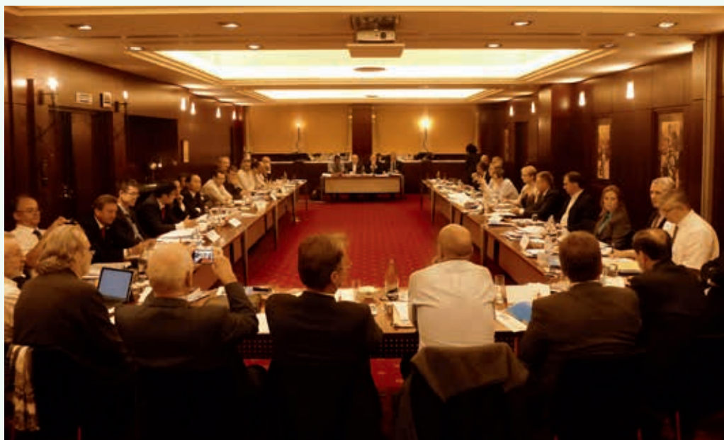
Ryc. 3. Posiedzenie zarządu Międzynarodowego Stowarzyszenia Technologii Bezwykopowych z udziałem członków zarządu reprezentujących organizacje bezwykopowe z pięciu kontynentów

Z dużym zainteresowaniem uczestnicy konferencji zwiedzali wystawę. Zwiększone zainteresowanie uczestników