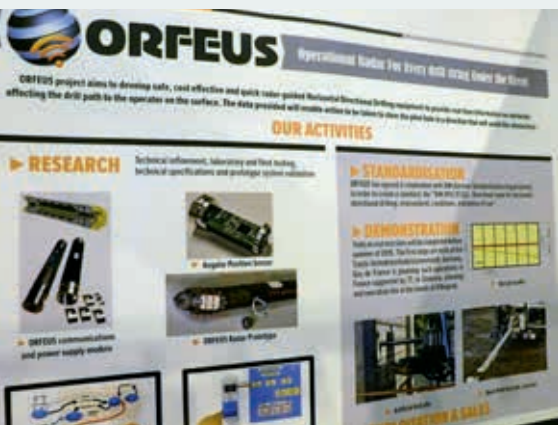
Ryc. 6. Prezentacja 7. ramowego programu europejskiego Orfeus