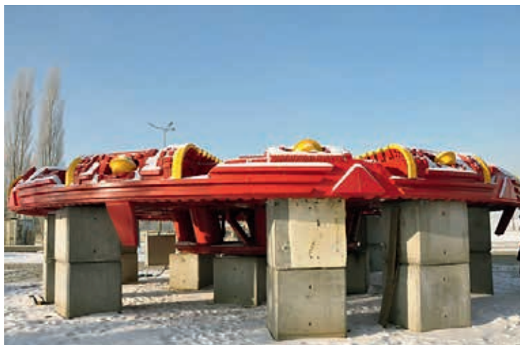
Ryc. 1. Maszyna TBM wraz z tarczą o średnicy ok. 13 m na placu budowy tunelu pod Martwą Wisłą, fot. archiwum WGiG AGH