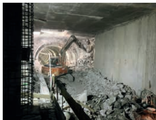
Ryc. 2. Plac budowy II linii metra w Warszawie (z lewej strony TBM Maria, z prawej wydrążona linia metra), fot. archiwum WGiG AGH

o czym świadczą liczba i zasięg realizowanych inwestycji. Jeszcze w tym roku ma zostać uruchomiony ok. sześciokilometrowy centralny odcinek II linii metra w Warszawie, którego fragment będzie 7–8 m pod dnem Wisły. Do drążenia podwójnych korytarzy dla poziomej kolejki użyto czterech specjalistycznych tarcz TBM. W Gdańsku powstaje długi na 1377,5 m tunel pod Martwą Wisłą w ramach budowy Trasy Słowackiego, który w najniższym położonym miejscu sięga 35,2013 m poniżej lustra wody. Obie nitki pierwszej w Polsce podwodnej przeprawy dla kierowców zostały już wydrążone i teraz prowadzone są pozostałe prace. Ich zakończenie planowane jest na 2015 r. Także w przyszłym roku do użytku oddany zostanie półtorakilometrowy tunel, który ma doprowadzać pociągi do podziemnego dworca Łódź Fabryczna. To obecnie największa inwestycja kolejowa realizowana w naszym kraju.