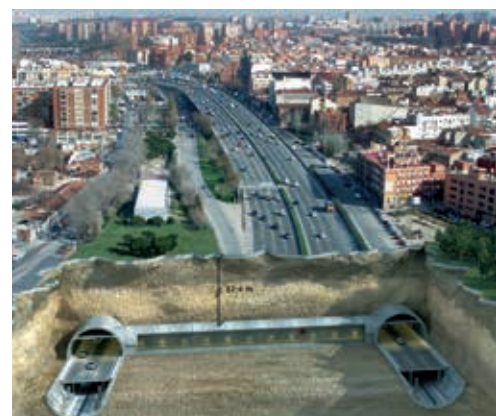
Ryc. 4. Tunel M-30 w Madrycie