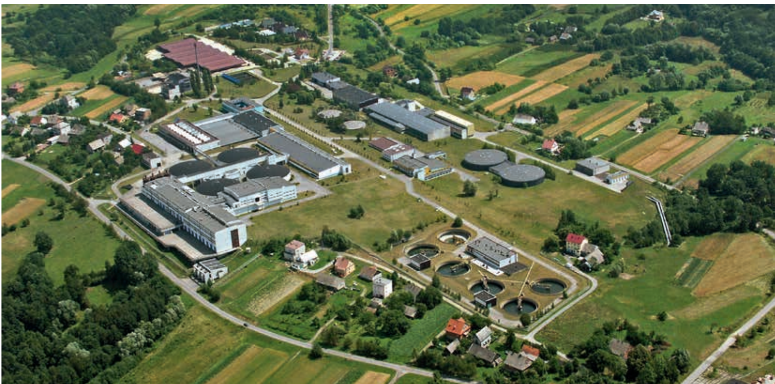
Zakład Uzdatniania Wody Raba

Proces technologiczny zastosowany w ZUW Raba polega na wstępnym ozonowaniu wody surowej, koagulacji, sedymentacji, filtracji oraz dezynfekcji. Do procesu technologicznego woda pobierana jest z trzech poziomów czerpania, zlokalizowanych na głębokościach 3,55 m, 9,65 m, 15,87 m poniżej poziomu wody Jeziora Dobczyckiego. Taki układ pozwala pobierać wodę z poziomu, na którym w danym okresie jest najczystsza. Kontrola jakości wody odbywa się w sposób ciągły, a każdy z poziomów jest automatycznie monitorowany co godzinę. System komputerowy podaje podstawowe informacje związane z jakością wody na poszczególnych poziomach, a dyspozytor podejmuje decyzję o poziomie poboru wody, uwzględniając zarówno informacje o jakości wody, jak