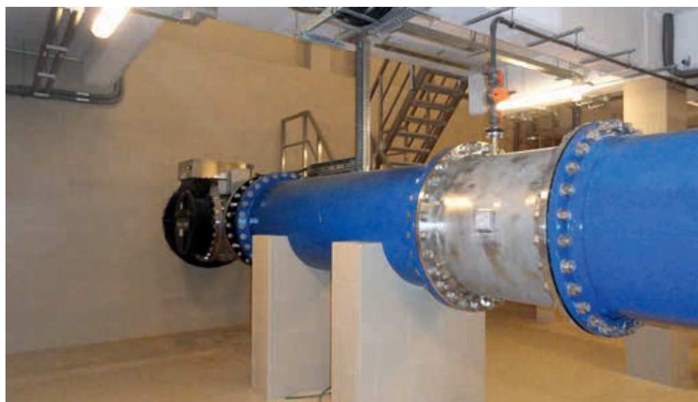
Wnętrze komory z fragmentem rurociągu wraz z zabudowanym promiennikiem UV i mieszaczem statycznym