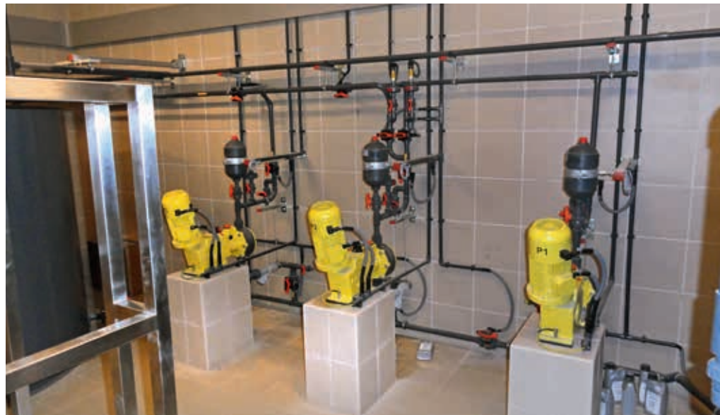
System dozowania roztworu podchlorynu sodu

Podchloryn sodu będzie produkowany na bieżąco według aktualnego zapotrzebowania, a jedynym produktem zgromadzonym w magazynie zakładu uzdatniania stanie się teraz sól kuchenna. W ten sposób wyeliminowane zostanie zagrożenie, jakie stwarza zmagazynowany na terenie zakładu chlor gazowy, a także transport 500-kilogramowych beczek z tą substancją.