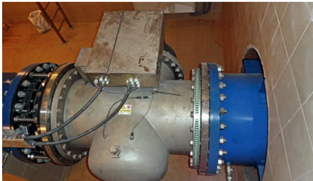
Promienniki UV zabudowane na rurociągu Raba II