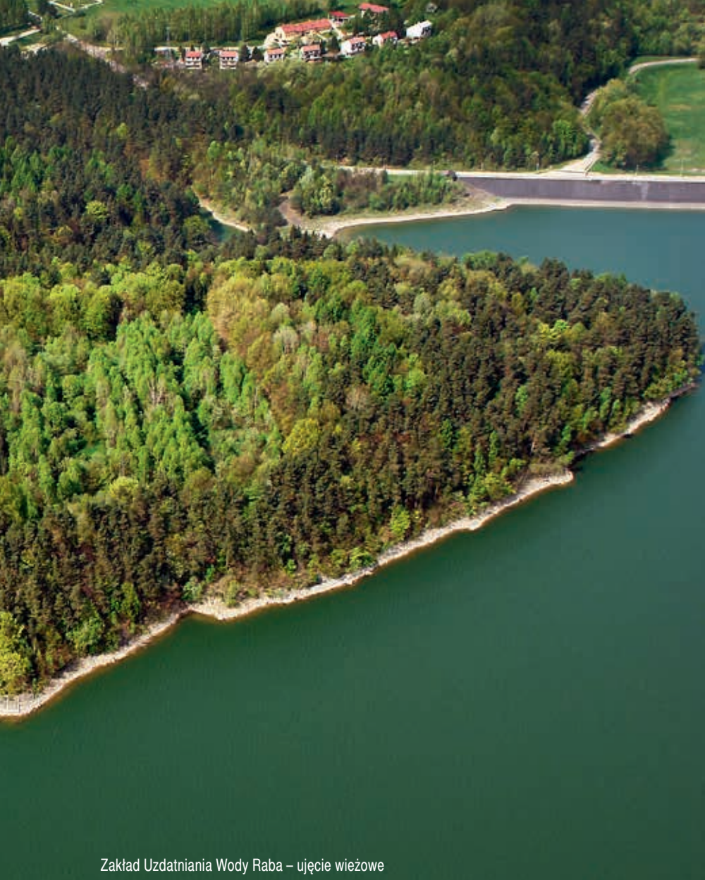
Zakład Uzdatniania Wody Raba – ujęcie wieżowe