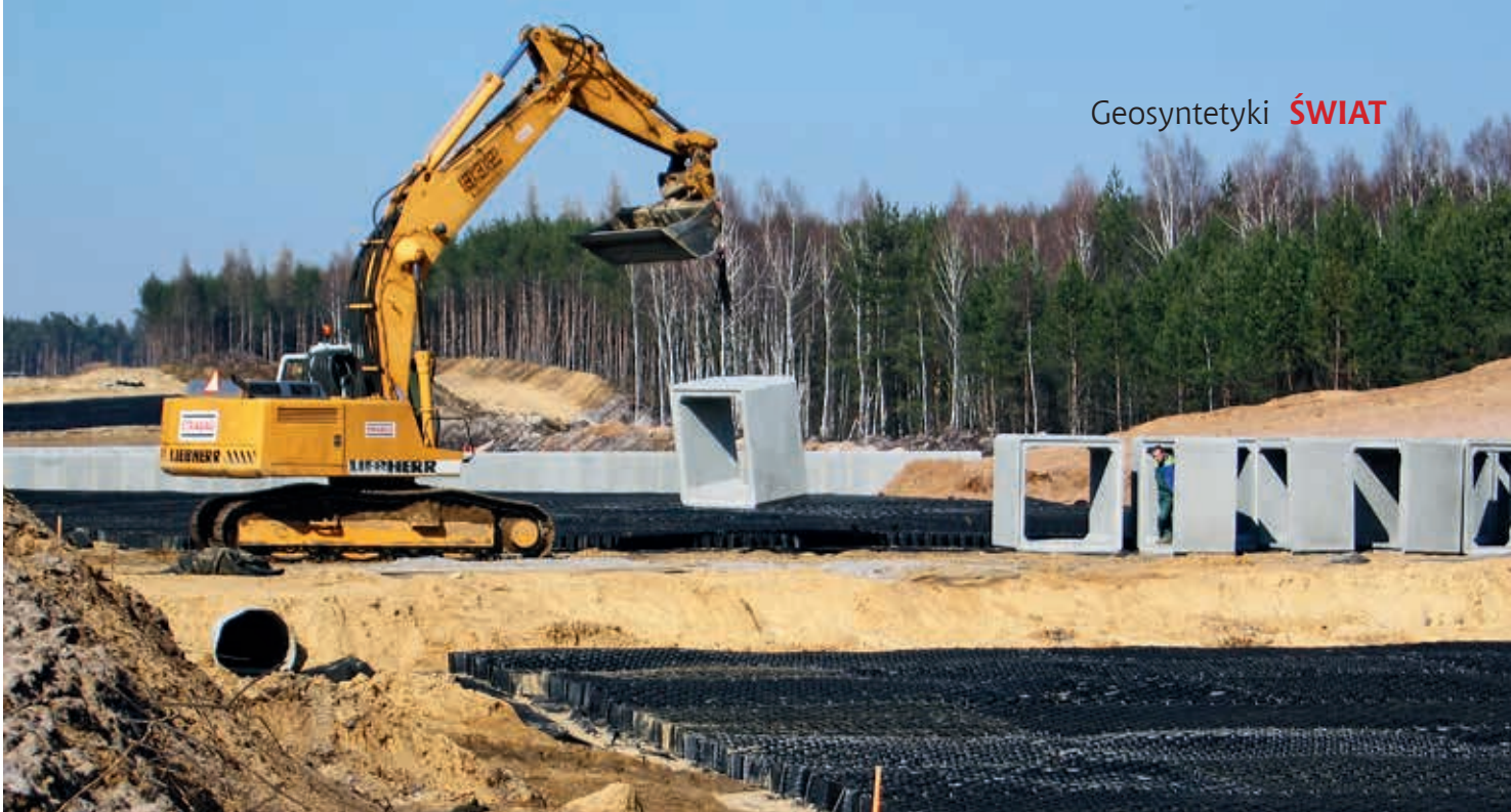
Autostrada A1 odcinek Bełk – Świerklany

terystycznego wymiaru porów oraz wodoprzepuszczalności w kierunku prostopadłym do powierzchni materiału. Geotekstyli użyte jako filtr w przypadku ochrony warstw drenażowych powinny ponadto spełniać, ze względu na oddziaływanie sprzętu zagęszczającego, takie same wymagania co do cech mechanicznych, jak dla warstwy separacyjnej.