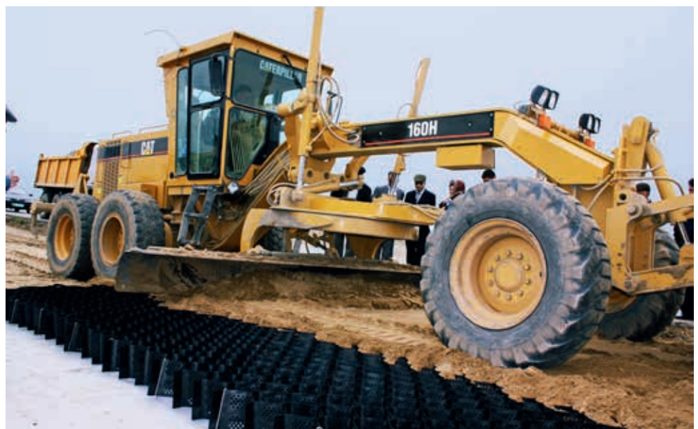
Budowa autostrady

Istotne cechy, którymi powinny się charakteryzować maty, to możliwość trwałego wypełnienia humusem, odpowiednie