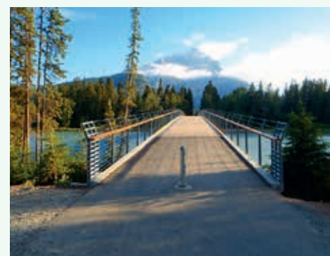
Ryc. 7. Kładka Bow River Bridge, Banff Kanada – zwycięzca w kategorii dużych kładek. Konstrukcja z drewna klejonego, rozpiętość głównego przęsła 80 m