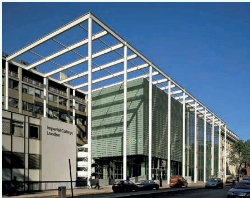
Ryc. 2. Widok budynku Imperial College London

Najwięcej referatów napłynęło z Wielkiej Brytanii – 41, a na drugim miejscu znalazły się Polska i Niemcy, których przedstawiciele zaprezentowali po 20 referatów. Tak więc udział polskiego środowiska inżynierii mostowej w londyńskiej konferencji był wyróżniający się zarówno liczebnie, jak i merytorycznie, co należy szczególnie podkreślić.