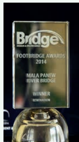
Ryc. 5. Most przez Małą Panew w Ozimku – dyplom i szklana statuetka zdobyta przez zespół projektowy z Politechniki Opolskiej za najwartościowszą rehabilitację historycznego obiektu

Obrady trwały trzy dni w salach wykładowych Imperial College London, z tym że każdego dnia zaczynały się od sesji plenarnych (ryc. 3), a potem w trzech potokach realizowany był program konferencji.