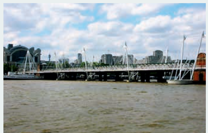
Ryc. 9. Mosty nad Tamizą w Londynie – stare i nowe