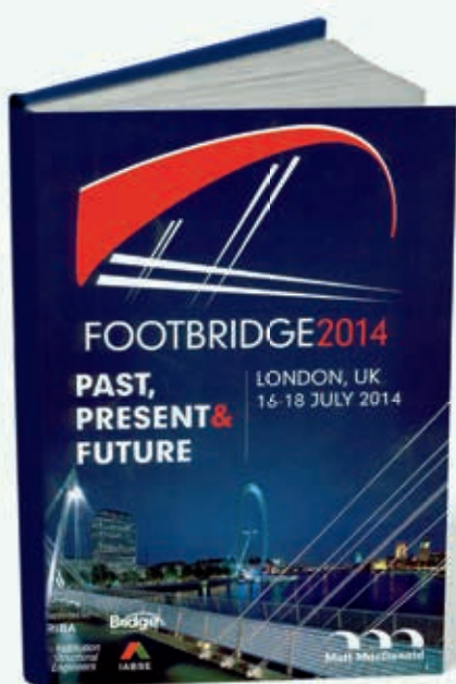
Ryc. 1. Okładka materiałów konferencyjnych Footbridge 2014

Materiały konferencyjne wydano w dwóch różnych księgach: jako klasyczne materiały konferencyjne formatu A4, w miękkiej oprawie, liczące 479 stron, w których wydrukowano w wersji czarno-białej 12 referatów kluczowych i 163 dwustronicowe streszczenia pozostałych prac (ISBN 978-0-7079-7139-1) oraz w wersji elektronicznej na płycie CD, gdzie pomieszczono pełne wersje wszystkich referatów.