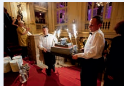
Jubileuszowy tort w kształcie systemu szynowego