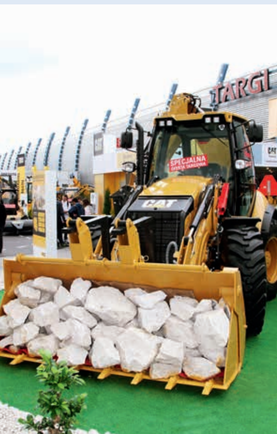
Koparko-ladowarka firmy Caterpillar

Polskiego Związku Pracodawców Budownictwa, Głównego Inspektora Pracy, Instytutu Badawczego Dróg i Mostów, Instytutu Mechanizacji Budownictwa i Górnictwa Skalnego, Polskiej Izby Konstrukcji Stalowych, Stowarzyszenia Inżynierów i Techników Komunikacji, Świętokrzyskiego Klubu Drogowca i Zrzeszenia Międzynarodowych Przewoźników Drogowych – jest wyznacznikiem wysokiej jakości merytorycznej zarówno samych targów, jak i licznych towarzyszących im konferencji, warsztatów i debat.