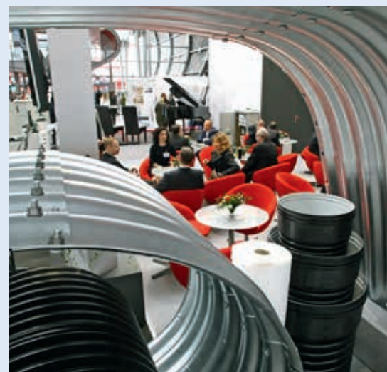
Producent rur stalowych – Viacon

Autostrada-Polska po raz kolejny objęta została patronatem Ministerstwa Infrastruktury i Rozwoju, Generalnej Dyrekcji Dróg Krajowych i Autostrad. Wsparcie najistotniejszych instytucji z branży – Ogólnopolskiej Izby Gospodarczej Drogownictwa,