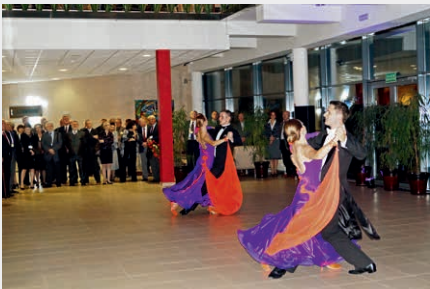
Występ Formacji Tańca Towarzystwa Politechniki Lubelskiej „Gamza”