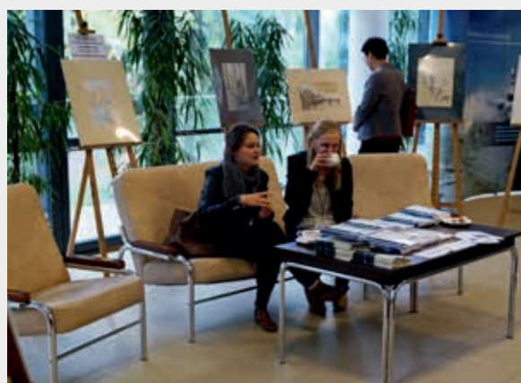
Wystawa prac studentów architektury na Wydziale Budownictwa i Architektury Politechniki Lubelskiej w hallu konferencji

dego naukowca: Stachema Polska i Wydawnictwo Naukowe PWN.