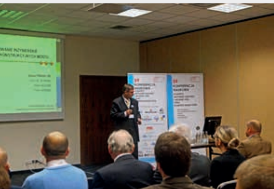
Jeden z referentów sesji Inżynieria komunikacyjna – mosty