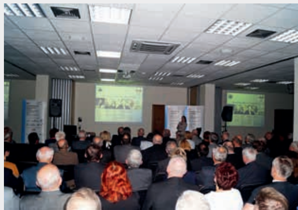
Prezentacja Kół Młodych PZITB Honor inżyniera

Referaty, zgodnie ze swoją tematyką, podzielone były na sesje: Budownictwo ogólne i rolnicze (4 referaty), Fizyka budowli (6 referatów), Inżynieria komunikacyjna – mosty (9 referatów), Inżynieria materiałów budowlanych (16 referatów), Inżynieria przedsięwzięć budowlanych (10 referatów), Konstrukcje betonowe (17 referatów), Konstrukcje metalowe (18 referatów), Mechanika konstrukcji i materiałów (11 referatów), Projektowanie geotechniczne (7 referatów), a także Zabytkowe obiekty budowlane (4 referaty) oraz Inżynieria wiatrowa (12 referatów).