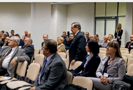
Dyskusja w czasie sesji Konstrukcje betonowe