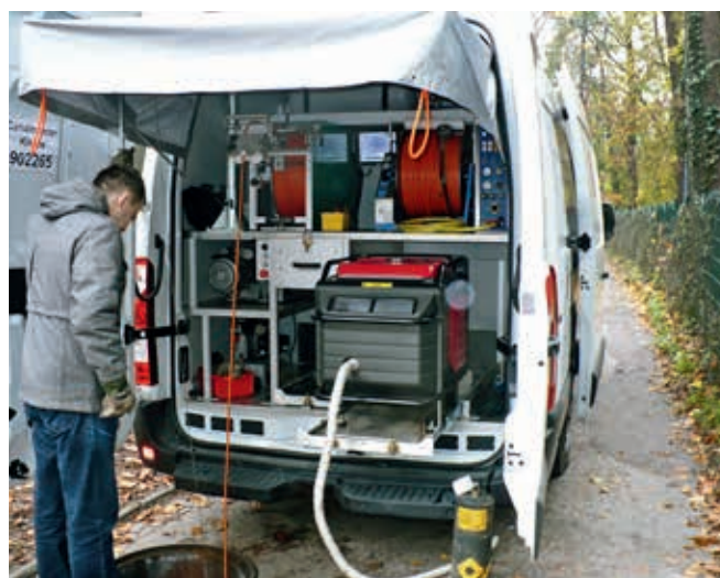
Ryc. 2. Wnętrze samochodu

Wprowadzenie techniki CCTV (ryc. 1, 2) do diagnostyki przewodów kanalizacyjnych [3, 6, 7] umożliwiło ogląd ich wnętrza. W różnych ośrodkach naukowych trwają prace [3, 6, 11, 12] nad metodą ustalenia prawdopodobieństwa awarii przewodów kanalizacyjnych na podstawie rodzaju i wielkości zaobserwowanych w nich uszkodzeń. Zagadnienie to jest trudne, ponieważ badanie CCTV nie dostarcza wielu danych, które są możliwe do uzyskania wyłącznie w wyniku ekspertyzy kanałów po ich odkopaniu, takich jak np. grubość nieskorodowanej lub niestartej ścianki kanału, parametrów wytrzymałościowych rur czy sposobu ich posadowienia na dnie wykopu.