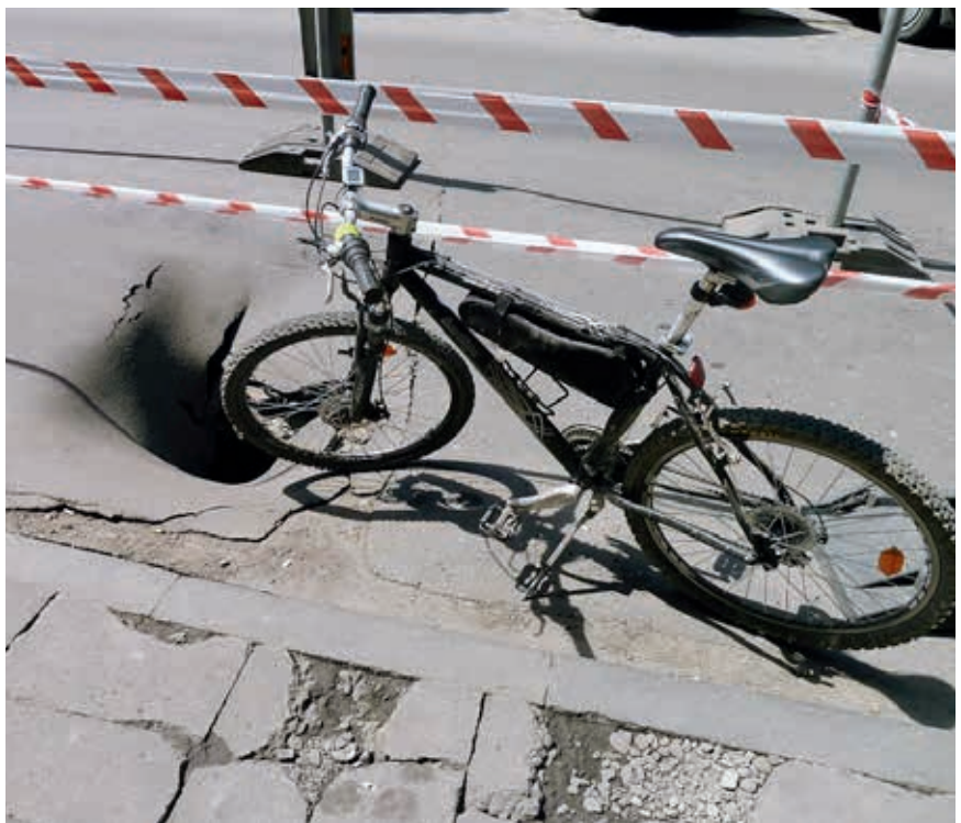
Ryc. 7. Zapadnięta nawierzchnia uliczna nad nieszczelnym kanałem

stwem awarii – analizowane jest także ryzyko awarii. Dzięki temu typowanie przewodów kanalizacyjnych do odnowy jest bardziej racjonalne, ponieważ metoda zastosowana do zarządzania stanem technicznym przewodów uwzględnia nie tylko stan techniczny przewodów kanalizacyjnych, ale także konsekwencje ich awarii.