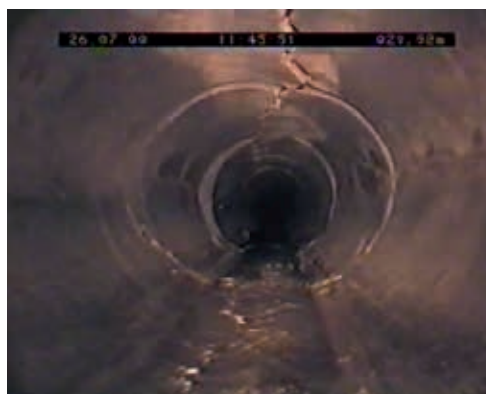
Ryc. 3. Rysy podłużne z przemieszczeniem fragmentów konstrukcji [3]

powanie przewodów kanalizacyjnych do odnowy według jej pilności, przy uwzględnieniu stanu technicznego przewodów, analizowanego oddzielnie dla kryterium bezpieczeństwa konstrukcyjnego i oddzielnie dla kryterium bezpieczeństwa eksploatacyjnego, uwzględniającego także zagrożenia środowiskowe. W metodzie tej – poza prawdopodobień-