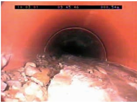
Ryc. 5. Osad stały w nowym przewodzie kanalizacyjnym [3]