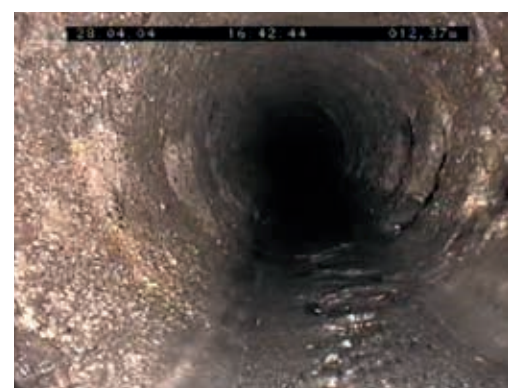
Ryc. 4. Skorodowane wnętrze przewodu kanalizacyjnego [3]