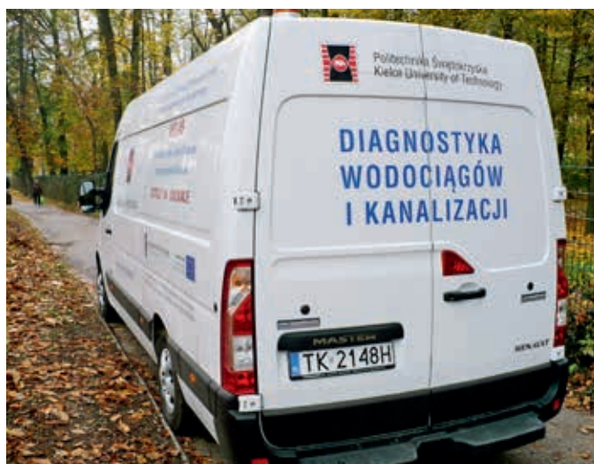
Ryc. 1. Samochód Politechniki Świętokrzyskiej ze sprzętem badawczym

Dokładna ocena stanu technicznego przewodu kanalizacyjnego jest możliwa po jego odkrywcie i wykonaniu ekspertyzy konstrukcyjnej. Przeprowadzanie takich ekspertyz na każdym przewodzie kanalizacyjnym w danym mieście byłoby jednak nieuzasadnione względami techniczno-ekonomicznymi.