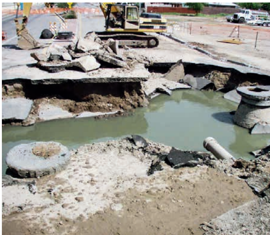
Ryc. 8. Katastrofa kanalizacyjna w Tucson (USA) [5]

niskie, brak konieczności eliminacji nieprawidłowości eksploatacyjnych.