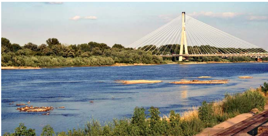
Widok na prawy (praski) brzeg Wisły w Warszawie, na wysokości centrum miasta (w tle most Świętokrzyski)

gram, ale należy go czytać w całości, a nie tylko przez „zielone” okulary, i rzetelnie wiedzę o nim w Polsce upowszechnić. Aby to zilustrować, pokażę dwie fotografie: Ren w Düsseldorfie i Wisłę w Warszawie. Pierwsza fotografia ilustrowała artykuł o tzw. renaturyzacji Renu (to publikacja z „Tygodnika Powszechnego”, udostępniona także na portalu Onet.pl), ale mało kto zwraca uwagę na prawie zupełnie pozbawione roślinności międzywale. Na fotografii z Warszawy widać z kolei bujną roślinność na praskim (niskim) brzegu Wisły, której usunięcie – niemożliwe według ekologów – obniżyłoby ostatnie wezbrania w stolicy o ok. 80 cm! Nie sposób pogodzić bezpieczeństwa i komfortu posiadania namiastki dzikiej rzeki w środku ponaddwumilionowego miasta. Zresztą, miasto od takiej rzeki po prostu się odwraca, a największe zainteresowanie budzi ona wówczas, gdy grozi przerwaniem wałów.