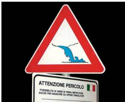
Znak w dolinie poniżej zapory. Ostrzeżenie o możliwych zmianach napełnienia koryta potoku w wyniku pracy urządzeń upustowych; północne Włochy