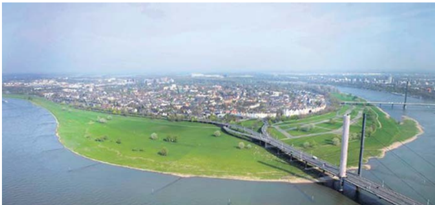
Ren w Dusseldorfie