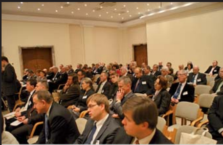
W Forum wzięło udział ponad 150 przedstawicieli drogowej administracji samorządowej wszystkich szczebli, wykonawcy i projektanci budownictwa drogowego, naukowcy

zmian ustawowych i wsparcia finansowego ze strony państwa.