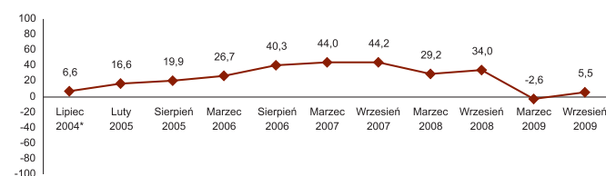
Indeks Koniunktury Budowlanej PMR, lipiec 2004-wrzesień 2009

Uwzględniono odpowiedzi 130 respondentów.