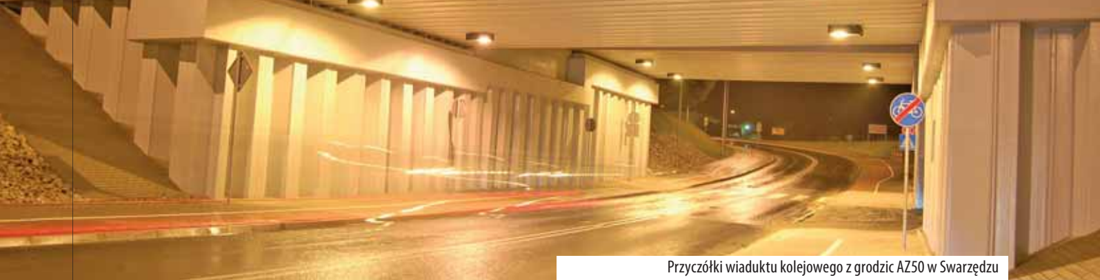
Przyczółki wiaduktu kolejowego z grodzic AZ50 w Swarzędzu

Grodzice stalowe są coraz częściej wykorzystywane jako stałe elementy konstrukcyjne w budownictwie lądowym. Wykonuje się z nich przyczółki wiaduktów, ściany oporowe i parkingi podziemne. Możliwość pośredniego posadowienia obiektów dają również pale stalowe, o takich samych grubościach pólek i średnika, wykonane ze specjalnych dwuteowników HP.