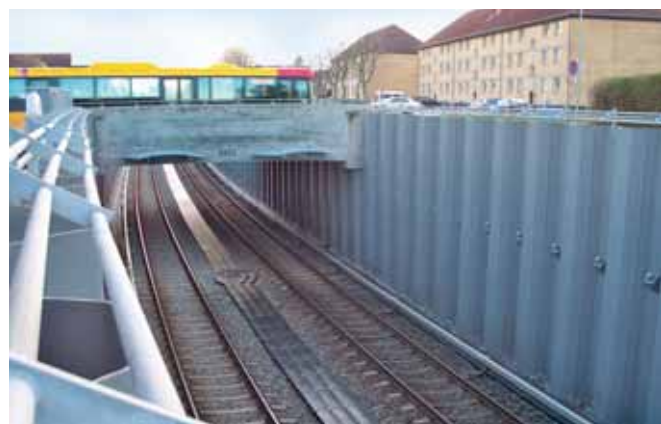
Ryc. 1. Ściana oporowa z grodzic AU20 – metro w Kopenhadze

Aspektem budzącym zawsze najwięcej obaw wśród projektantów, decydujących się na rozwiązania oparte na grodzicach lub palach stalowych, była korozja stali w środowisku gruntowym i wodnym. Brakowało narzędzia ułatwiającego poruszanie się w tej materii. Sytuacja zmieniła się w marcu 2007 r., gdy opublikowano normę uznaniową PN-EN 1993-5:2007 (U) Eurokod 3 – Projektowanie konstrukcji stalowych. Część 5: Palowanie i grodze .