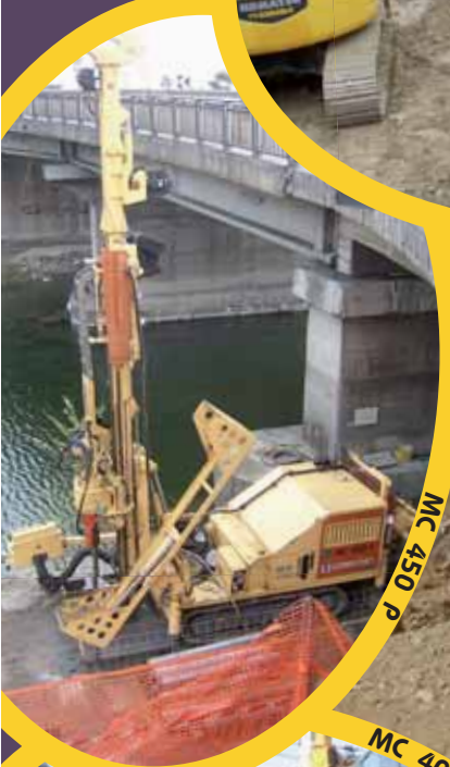
MC 450 P