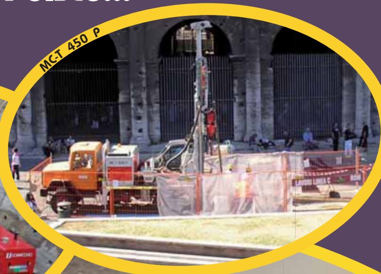
MCT 450 P