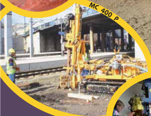
MC 400 P