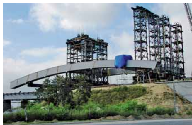
Ryc. 8. Element montażowy łuku