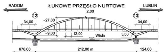
Ryc. 4. Widok z boku projektowanego mostu