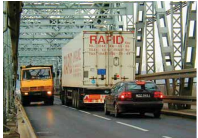
Ryc. 2. Ruch na istniejącym moście, fot. K. Grej