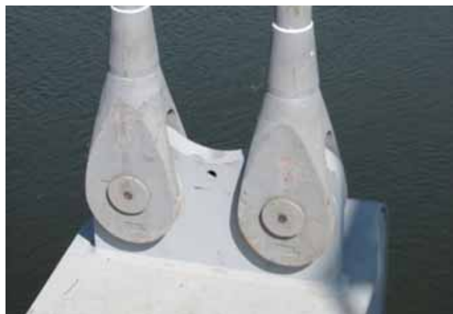
Ryc. 6. Zamocowania wieszaków we wspornikach poprzecznic

Podwieszenie pomostu do łuków zaprojektowano w postaci 14 par wieszaków. Każdy z nich składa się z czterech cięgien prętowych o średnicy 81 mm. Cięgna połączone są zarówno z poprzecznicami na dole (ryc. 6), jak i z konstrukcją łuku na górze przy pomocy uchwyty widelcowych. Długości cięgien wynoszą od 3,5 do 24 m. W cięgnach dłuższych niż 12 m zaprojektowano przewiązki, które mają za zadanie tłumić drgania.