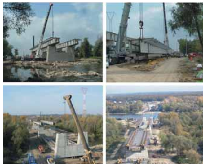
Ryc. 7. Montaż prześel nad terenem zalewowym, fot. Archiwum Nadzoru Budowlanego

brzegu (ryc. 7). Następnie ustawiono na trzech wieżach (każdy element) i przesuwano zestaw po torze ułożonym na pomoście do położenia docelowego. Po przesunięciu wszystkich elementów połączono segmenty łuku, łuk z pomostem i podwieszono pomost.