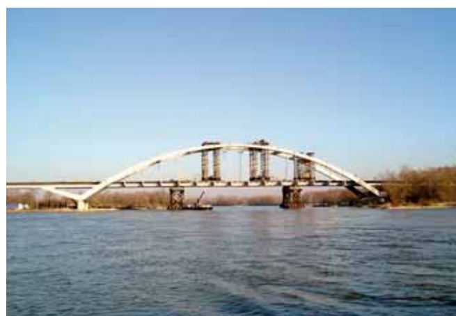
Ryc. 9. Montaż przęśla nurtowego

Następnie wykonano współpracującą ze stalowymi dźwigarami żelbetową płytę pomostu.