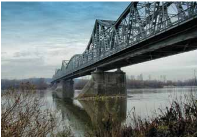
Ryc. 1. Widok starego mostu im. Ignacego Mościckiego w Puławach

W Puławach droga nr 12 przekracza rzekę Wisłę po istniejącym moście im. Ignacego Mościckiego (ryc. 1). Most ten został zbudowany w latach 1931–1934. Jego konstrukcję nośną stanowią stalowe dźwigary kratownicowe, z jazdą dołem, o zmiennej krzywiznie pasa górnego. Most składa się z pięciu przęseł, z których najdłuższe ma rozpiętość 110 m. Całkowita długość obiektu wynosi 480 m.