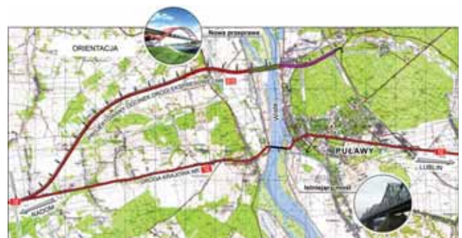
Ryc. 3. Realizowana obwodnica Puław

Most ma długość 1012 m, a położony z lewej strony rzeki wiadukt stanowi jego przedłużenie. Całkowita długość przeprawy równa jest 1038 m (ryc. 3). Szerokość mostu wynosi 22,3 m. Schemat statyczny to belka 14-przęsłowa, w przęśle nurtowym współpracująca z łukiem stalowym. Rozpiętość przęsła nurtowego równa jest 212 m. Na zalewach konstrukcja nośna w przekroju poprzecznym składa się z dwóch par belek połączonych poprzecznikami o stałym rozstawie, wynoszącym 4,0 m (ryc. 4). Na konstrukcji stalowej spoczywa płyta betonowa współpracująca zarówno z poprzecznikami, jak i z belkami głównymi. Na płycie usytuowane są dwie rozdzielone jezdnie, każda z nich składa się z dwóch pasów ruchu po 3,5 m. Wraz z opaskami bezpieczeństwa, licząc w świetle krawężników, jezdnia liczy 2 x 8,6 m szerokości. Po południowej stronie jezdni usytuowany jest chodnik o szerokości 1,5 m, a przeznaczony tylko dla obsługi mostu chodnik po stronie północnej ma szerokość 1,0 m.