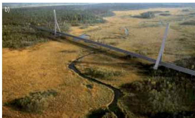
Rys. 1. Alternatywna przeprawa nad Rosupdą: a) most wiszący; b) most podwieszony