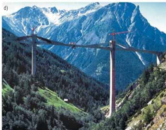
Rys. 3. Przykłady obiektów mostowych usytuowanych na terenach cennych przyrodniczo: a) most Normandii u ujścia Sekwany, b) wiadukt nad doliną rzeki Tarn w Millau – Francja; c) Navajo Bridge – Kanion Kolorado [4]; d) Ganter – Szwajcaria [5]

□ mostu podwieszono o całkowitej długości 787 m. Most składa się z czterech przęseł bocznych z każdej strony (zaprojektowanych z betonu sprężonego) i stalowego przęsła głównego. Rozpiętości poszczególnych przęseł są następujące: 4 \times 30 + 540 + 4 \times 30 m; wysokość pylonów żelbetonowych wynosi 125 m. Ustrój nośny to dźwigar ciągły złożony z dwóch części z betonu sprężonego i środkowej części ze stali ( 147 + 486 + 147 m).