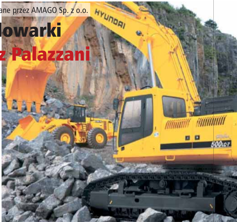
Maszyny HYUNDAI: koparka gąsienicowa R 500 LC-7 i ładowarka HL 780-7A

W zakresie koparko-ładowarek i ładowarek lekkich AMAGO proponuje maszyny PALAZZANI. Są to koparko-ładowarki (waga 3,8 t), ładowarki lekkie (waga 3,8–8,3 t, pojemność łyżki 0,5–1,5 m 3 ) i teleskopowe (waga 6,1–8,7 t, pojemność łyżki 0,75–1,2 m 3 ).