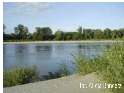
Aby chronić takie krajobrazy (nawet tylko w okresie budowy klasycznego przejścia rurociągu pod dnem rzeki)...

głowicy za straconą. W czasie wezbrania strumień wody może odkryć posadowiony w osadach rzecznych przewód, co spowoduje narażenie go na kontakt z ciałami wleczonymi lub płynącymi tuż nad dnem. Elementy te mogą ścierać ścianki albo uderzać w rurociąg. Jeśli dojdzie do wymycia gruntu spod rurociągu, zostanie on poddany obciążeniu, na które nie był projektowany (brak podparcia, działanie dynamiczne wody). W skrajnym przypadku może dojść do przerwania rurociągu.