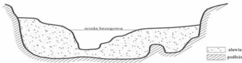
Rys. 1. Charakterystyczny przekrój poprzeczny aluwialnej doliny rzecznej [6]

Wobec danych o obserwowanych głębokościach rozmywania dna dużych rzek nizinnych w Polsce (do kilkunastu metrów poniżej dna koryta) i przyjmowania poziomu posadowienia rurociągu tak, aby jego górna krawędź znajdowała się 1 m poniżej stropu warstwy nierozmywanej, dochodzimy zwykle do bardzo dużego zagłębienia rurociągów. Dlatego