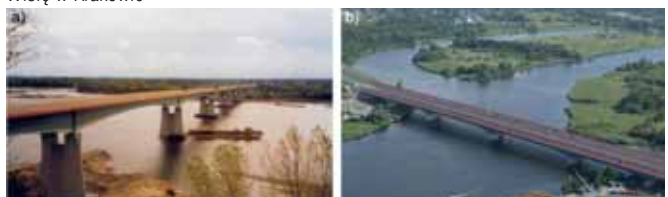
Rys. 4. Nowoczesne stalowe mosty belkowe: a) most przez Wisłę w Wyszogrodzie, b) most przez Regalicę w Szczecinie

Metody stosowane przy budowie dużych obiektów mostowych są różnorodne. Belkowe mosty betonowe z przęsłami dużej długości wykonywane są wyłącznie metodą betonowania nawisowego (rys. 5a, 6b) [11, 12, 16, 26, 28, 32], a w przypadku