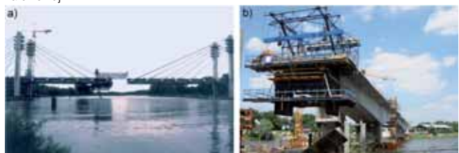
Rys. 6. Most Tysiąclecia we Wrocławiu: a) w trakcie betonowania wspornikowego mostu podwieszono, b) w trakcie betonowania wspornikowego mostu nawisowego