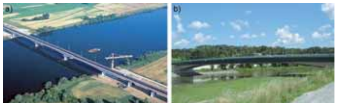
Rys. 3. Mosty belkowe z betonu sprężonego o najdłuższych przęsłach w Polsce: a) most przez Wisłę w Toruniu w ciągu autostrady A1, b) most Zwierzyniecki przez Wisłę w Krakowie