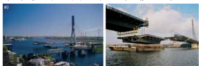
Rys. 8. Montaż nawisowy przęsła: a) mostu Martwą Wisłę w Gdańsku, b) mostu przez Wisłę w Płocku