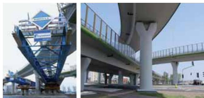
Rys. 11. Wiadukty na Węźle Czerniakowska w ciągu Trasy Siekierkowskiej w Warszawie