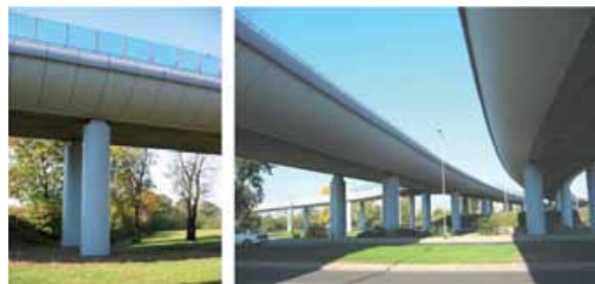
Rys. 10. Estakady we Wrocławiu w ciągu Obwodnicy Śródmiejskiej

Inną grupę dużych obiektów mostowych stanowią długie estakady miejskie. Zazwyczaj są to wieloprzęsłowe ustroje z betonu sprężonego o długości kilkuset metrów. Przykładem mogą być dwie ostatnio wybudowane estakady. Pierwsza została wybudowana we Wrocławiu w ciągu Obwodnicy Śródmiejskiej (rys. 10) o długości ponad 600 m [8, 9]. Druga wybudowana w Warszawie, w ciągu Trasy Siekierkowskiej (rys. 11) o długości ponad 800 m [37]. Obie konstrukcje wybudowano metodą nasuwania podłużnego (długość nasuwanych fragmentów to 2 x 430 m we Wrocławiu i 2 x 590 m w Warszawie).