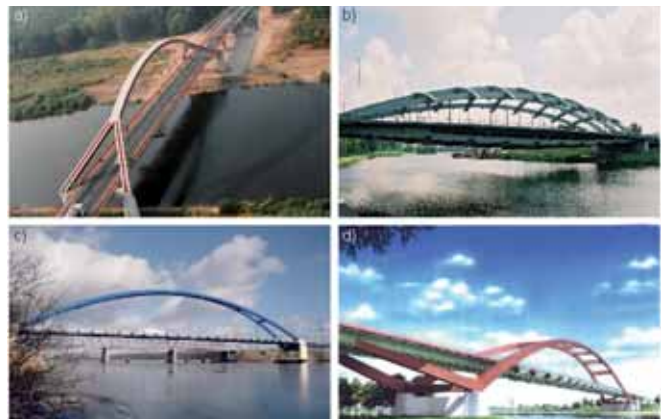
Rys. 2. Mosty łukowe o najdłuższych przęsłach w Polsce w kolejności ich budowy: a) most przez Narew w Ostrołęce, b) most Kotlarski przez Wisłę w Krakowie, c) most przez Dziwną w Wolinie w ciągu drogi krajowej nr 3, d) most przez Wisłę w Puławach (wizualizacja)