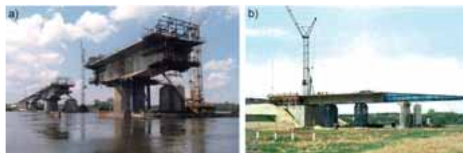
Rys. 5. Most autostradowy przez Wisłę w Toruniu: a) w trakcie betonowania wspornikowego przęsła w części nurtowej, b) w trakcie nasuwania przęsła w części zalewowej

konstrukcji długich, z przęsłami rozpiętości do 60 m, ma zastosowanie również nasuwanie podłużne (rys. 5b) [26]. W przypadku mostów stalowych montaż odbywa się zazwyczaj przy pomocy dźwigów z użyciem podpór tymczasowych, stosuje się też nasuwanie podłużne, polegające na tym, iż przęsła po scałeniu są nasuwane na podpory [25, 29]. Najbardziej interesujące w tym zakresie było nasuwanie stalowej konstrukcji mostu przez Wisłę w Wyszogrodzie (rys. 7a), gdzie przęsła nurtowe mostu długości 100,00 m zostały pokonane bez użycia podpór tymczasowych, przy zastosowaniu jedynie podwieszenia tymczasowego – wspornika w trakcie nasuwania. Konstrukcja stalowa przęsła, ze względu na zakrzywiony pas dolny, była ustawiona na technologicznej belce ślizgowej. Inny sposób nasuwania pokazano na rys. 7b (most przez Wartę w ciągu A2).