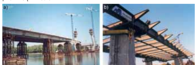
Rys. 9. Nasuwanie podłużne przęsła: a) mostu Siekierkowskiego w Warszawie [18], b) mostu Świętokrzyskiego w Warszawie [1]

W przypadku mostów podwieszonych znajduje zastosowanie kilka różnych technologii budowy przęsła, takich jak: montaż nawisowy (rys. 8) – most Trzeciego Tysiącle-