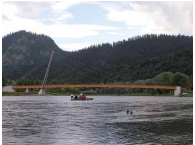
Rys. 15. Kładka dla pieszych przez Dunajec w Sromowcach Niżnych – aktualnie w budowie (sierpień 2006)