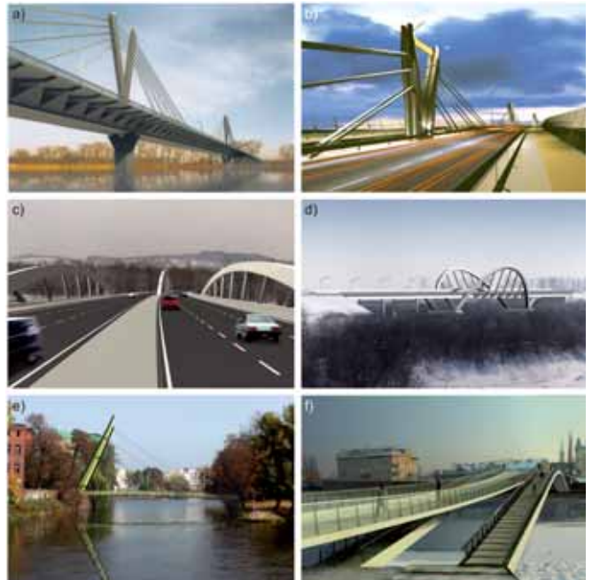
Rys. 16. Wybrane projekty konkursowe: a) most przez Odrę we Wrocławiu w ciągu Obwodnicy Śródmiejskiej, b) wiadukt nad terenami Dworca Świebodzkiego we Wrocławiu w ciągu Obwodnicy Staromiejskiej, c) most Pychowicki przez Wisłę w Krakowie, d) most przez Dunajec w ciągu Obwodnicy Nowego Sącza, e) kładka na Wyspę Słodową we Wrocławiu, f) kładka przez Wisłę Kazimierz – Podgórze w Krakowie

Na świecie cenione są obiekty nietypowe [1], mające szansę szerszego oddziaływania na otoczenie. Aby tego rodzaju obiekty powstały w Polsce, inwestorzy muszą widzieć w budowie obiektów nietypowych szansę promocji miasta czy nawet kraju. Na rysunku 16 pokazano wybrane koncepcje konkursowe wykonane przez ZB-P Mosty Wrocław, zaprojektowane przy takim założeniu. Niestety, nie miały one szczęścia w konkursach.