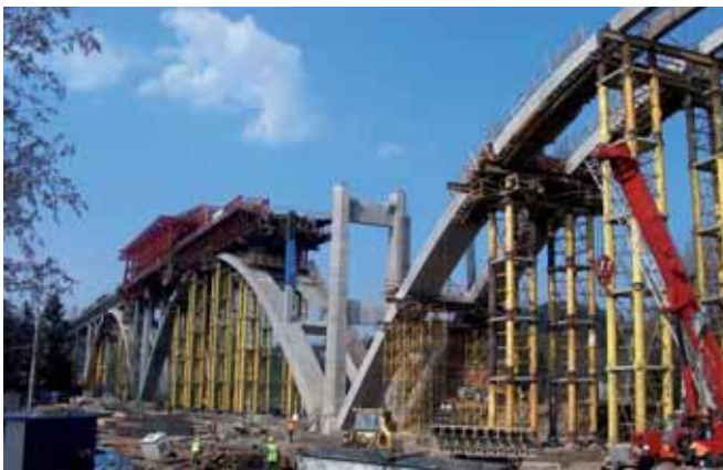
Rys. 12. Most łukowy w ciągu drogi ekspresowej S69 przez dolinę rzeki Kameszniczanka – w trakcie budowy