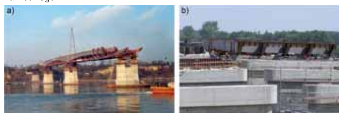
Rys. 7. Nasuwanie podłużne konstrukcji stalowej przęsła: a) mostu przez Wisłę w Wyszogrodzie, b) mostu przez Wartę w ciągu autostrady A2