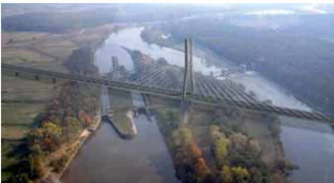
Rys. 14. Mostu przez Odrę we Wrocławiu w ciągu autostrady A8 (wizualizacja) – aktualnie projektowany