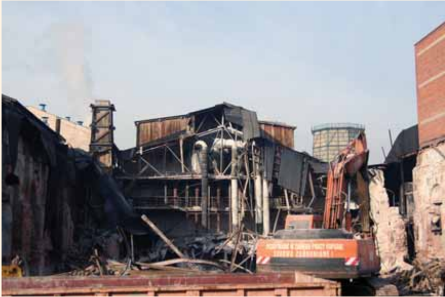
Rozbiórka budynków Starej Warzelni

tak samo jak goście, którzy zwiedzali kopalnię kilkaset lat temu. Była to tzw. diabelska jazda. Różnica polega tylko na tym, że współcześni turyści będą mieli na sobie zabezpieczenia alpinistyczne. Będą zwiedzać kopalnię w jej części nie zmienionej, nie przystosowanej do ruchu turystycznego. Jest tam ciemno, są niskie, niewygodne, zwykle zawilgocone chodniki. Słowem jest tak, jak za czasów dawnych górników. To oferta dla wąskiej grupy osób, zainteresowanych poznaniem kopalni w jej „najprawdziwszym” wydaniu.