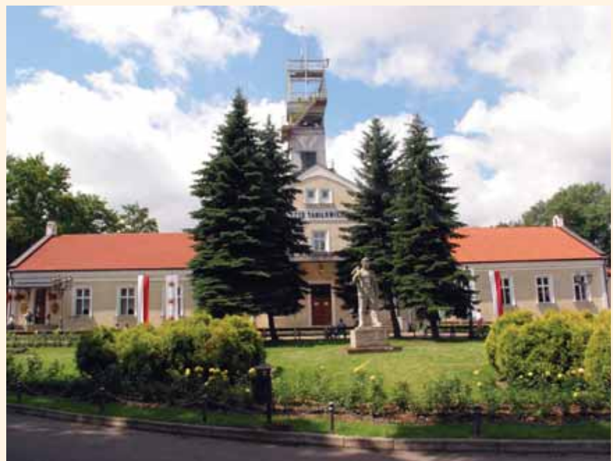
Nadszybie szybu Daniłowicza, zglębionego w 1 poł. XVII w.

bu Daniłowicza. Przywrócony zostanie jego historyczny kształt i klimat, a wypoczywać w nim będą zarówno nasi goście, jak i mieszkańcy Wieliczki. Na jego zachodnim krańcu powstanie nowy parking, w miejscu zlikwidowanego miesiąc temu komina kotłowni. Do niedawna w parku istniał budynek łazienek salinarnych, który ze względu na zły stan techniczny został rozebrany. W jego miejscu powstanie wierna kopia budynku z początku wieku, który będzie pełnił rolę hotelu dla