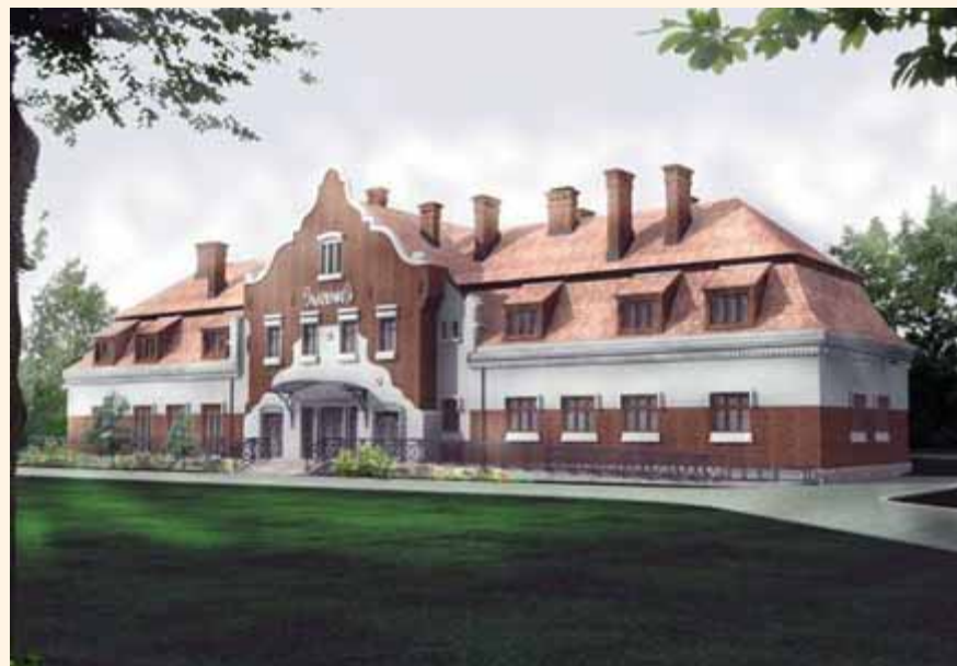
Wizualizacja nowych Łazienek Salinarnych