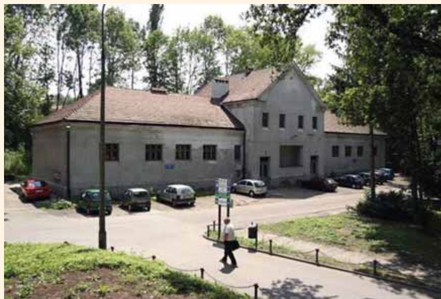
Budynek Łazienek Salinarnych

gościom się podoba, a co nie, i staramy się na to reagować. Dawniej kiedy mówiliśmy, że kopalnia może się utrzymywać z turystyki, ludzie pukali się w głowę, twierdzili, że przy tak dużych kosztach likwidacji kopalni to niemożliwe. Dzisiaj zarabiamy więcej na turystyce niż wtedy na soli. Ale musieliśmy zmienić swoje podejście. Po zaprzestaniu wydobycia soli musieliśmy przestawić się na turystykę profesjonalną. Przyjeżdżają ludzie, którzy za zwiedzanie płacą poważne pieniądze i mają otrzymać poważną usługę. Pod ziemią planowaliśmy konferencje, bale, koncerty, ale wszystko to by się nie powiodło, gdyby nie odpowiednio wysoki standard organizacyjny. Sposób myślenia musiał się zmienić najpierw