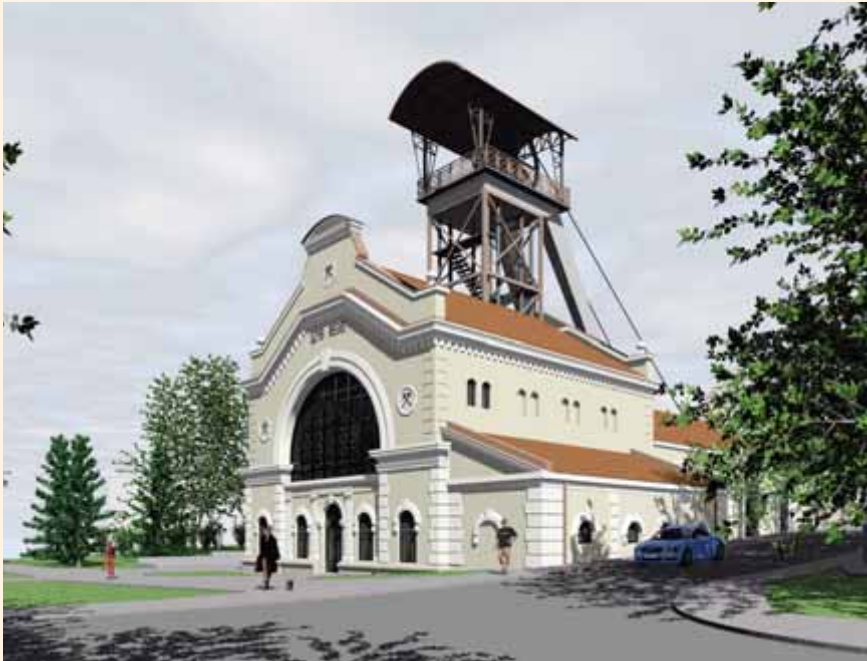
Nadszybie szybu „Regis” (Królewskiego) wydrążonego na początku 2 poł. XIV w.

wśród tych, którzy byli na „pierwszej linii”, czyli pracowali w części turystycznej. I tam te zmiany następowały najszybciej. Później także wśród pozostałej załogi, wśród górników.